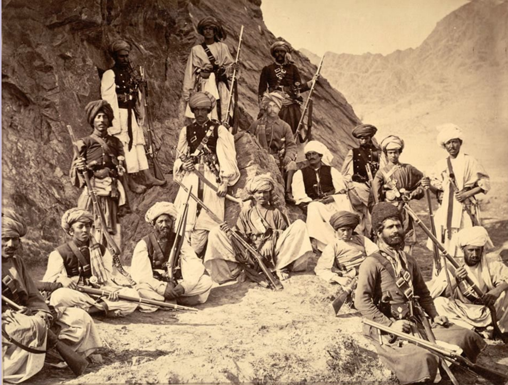
Отряд стрелков басмачей 1925 год