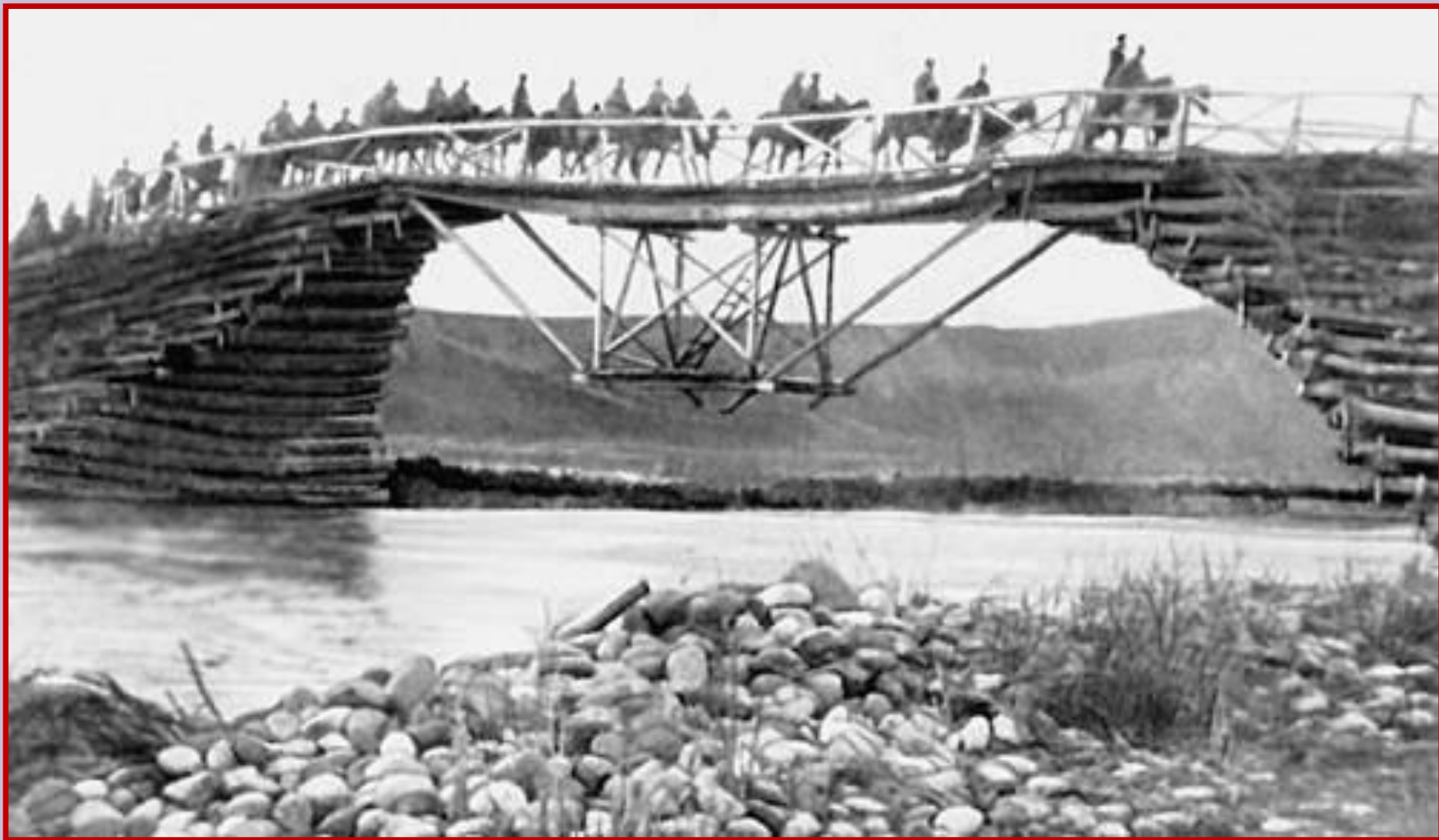
Переход Красной армии через р. Душанбинка. Апрель 1929 г.