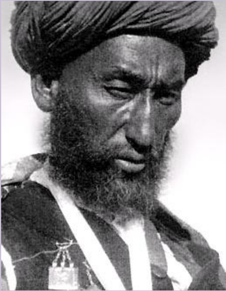
Лидер исламистов Узбекистана Ибрагим бек Чакабоев