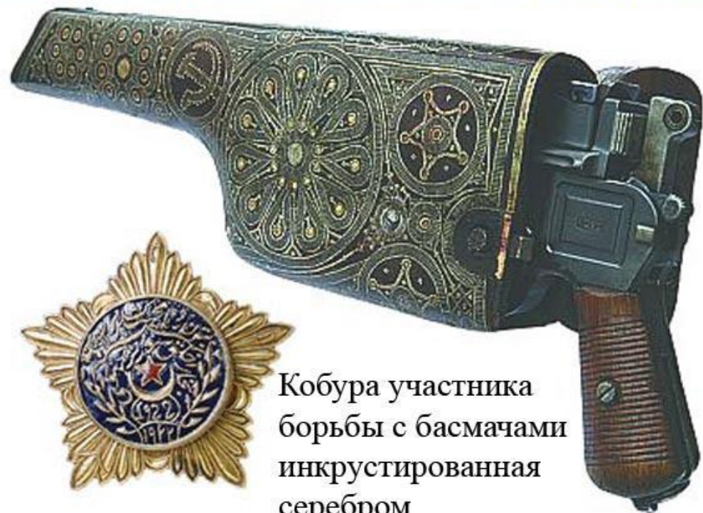
Кобура участника борьбы с басмачами инкрустированная серебром