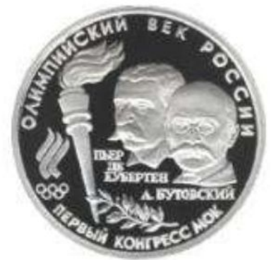
Монета ЦБ РФ