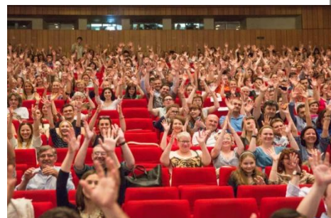
ул. Сретенка, д. 28