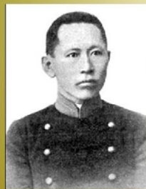
Гомбожаб Цэбекович Цыбиков

Путешественник, этнограф, востоковед, буддолог, государственный и общественный деятель Российской империи, СССР и Монголии, переводчик, профессор ряда университетов.