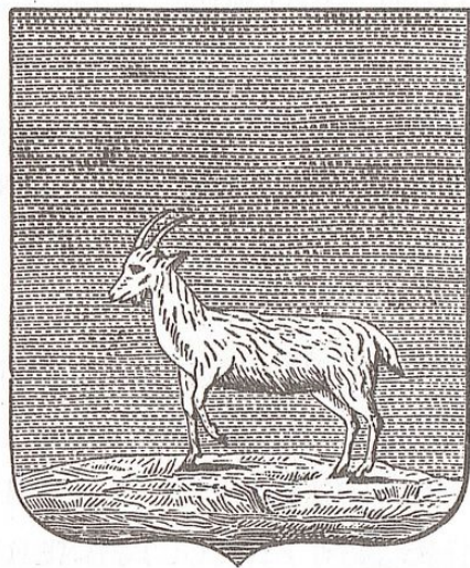
Герб г. Самары Симбирского наместничества Утвержден 22 декабря 1780 г. Дикая коза белая, стоящая на траве, в голубом поле