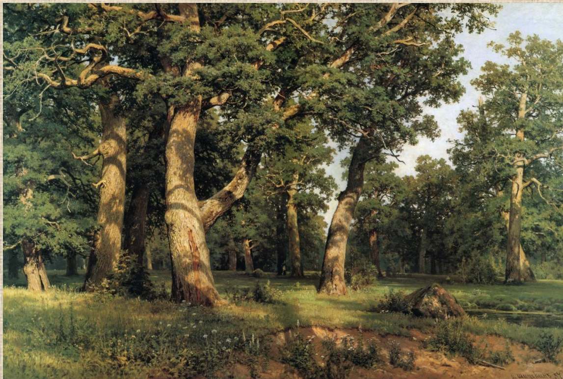
И.И.Шишкин. Дубовая роща. Россия XIX в.