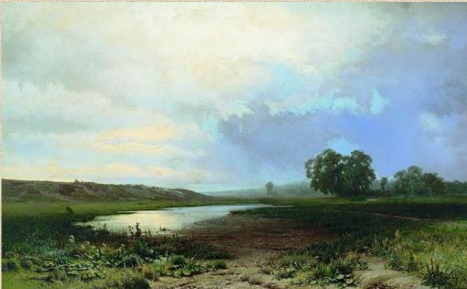
Ф.А.Васильев. Мокрый луг. Россия XIX в.