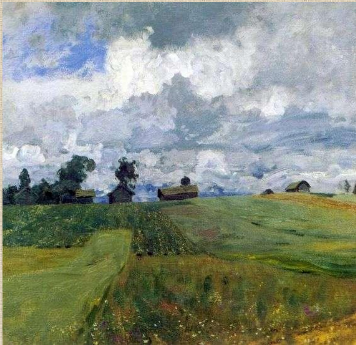
И.И.Левитан. XIXв. Бурный день.