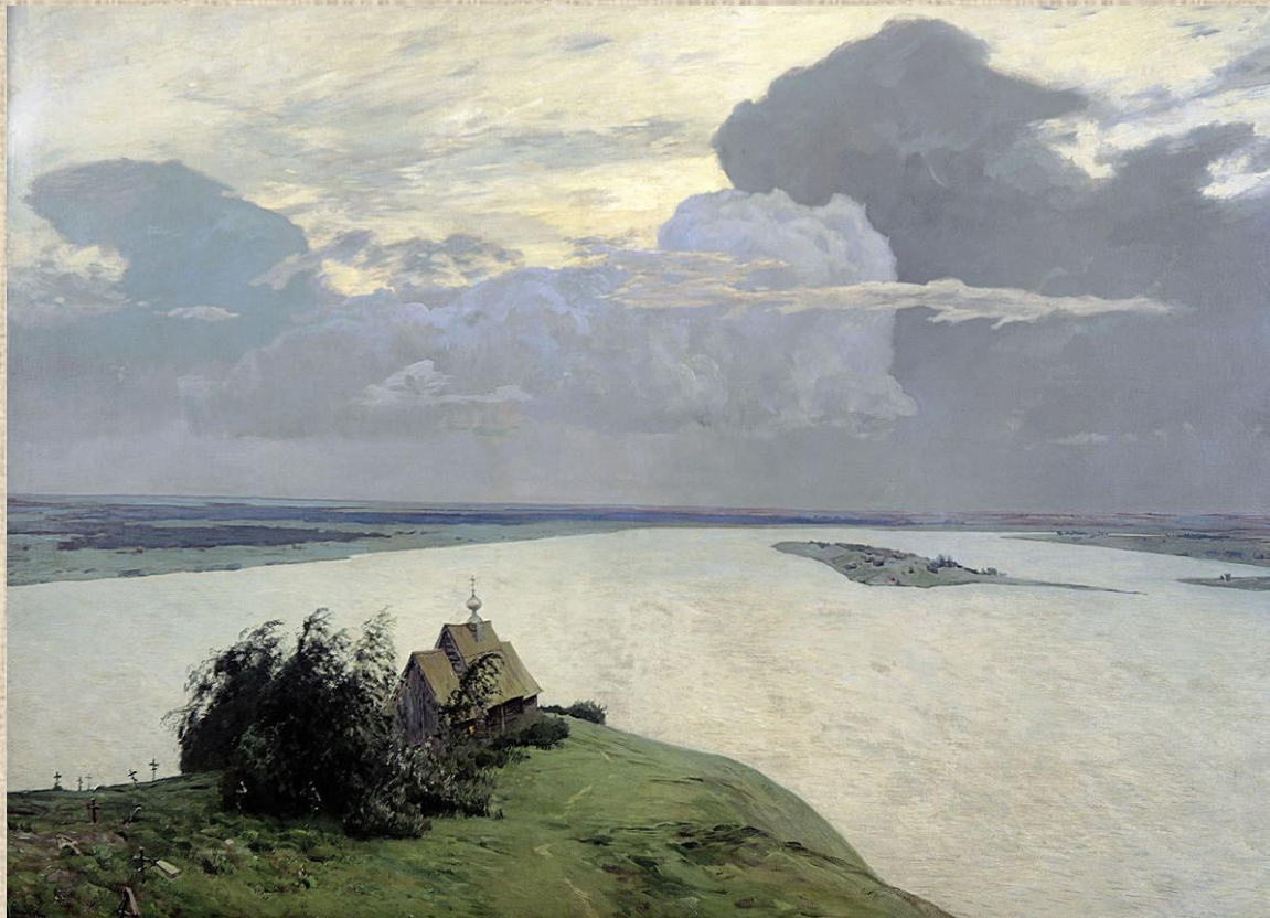
И.И.Левитан. Над вечным покоем.