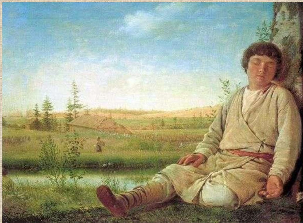
А.Г. Венецианов. Спящий пастушок. Россия XIX в.