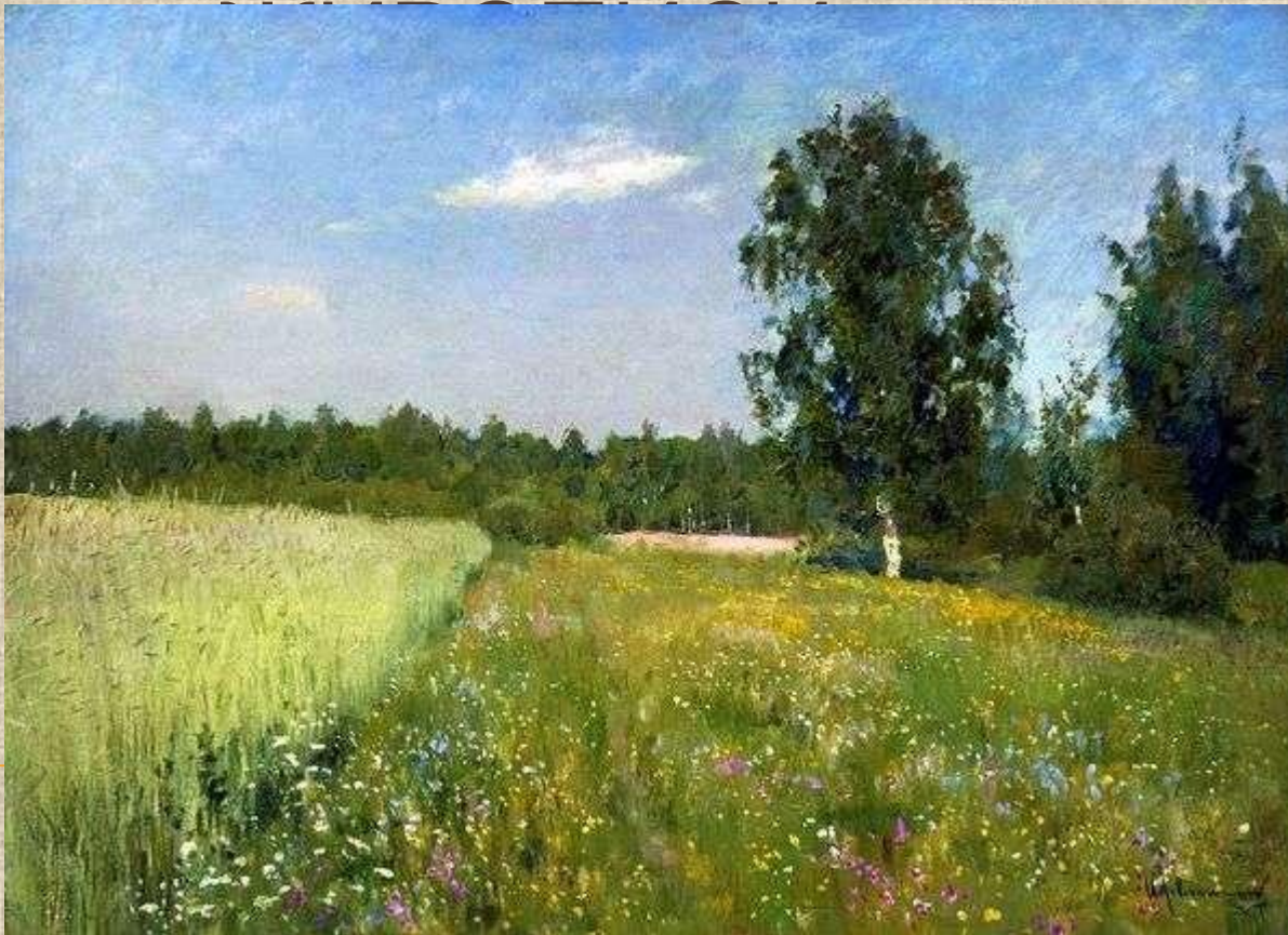
И.И.Левитан. Июньский день.