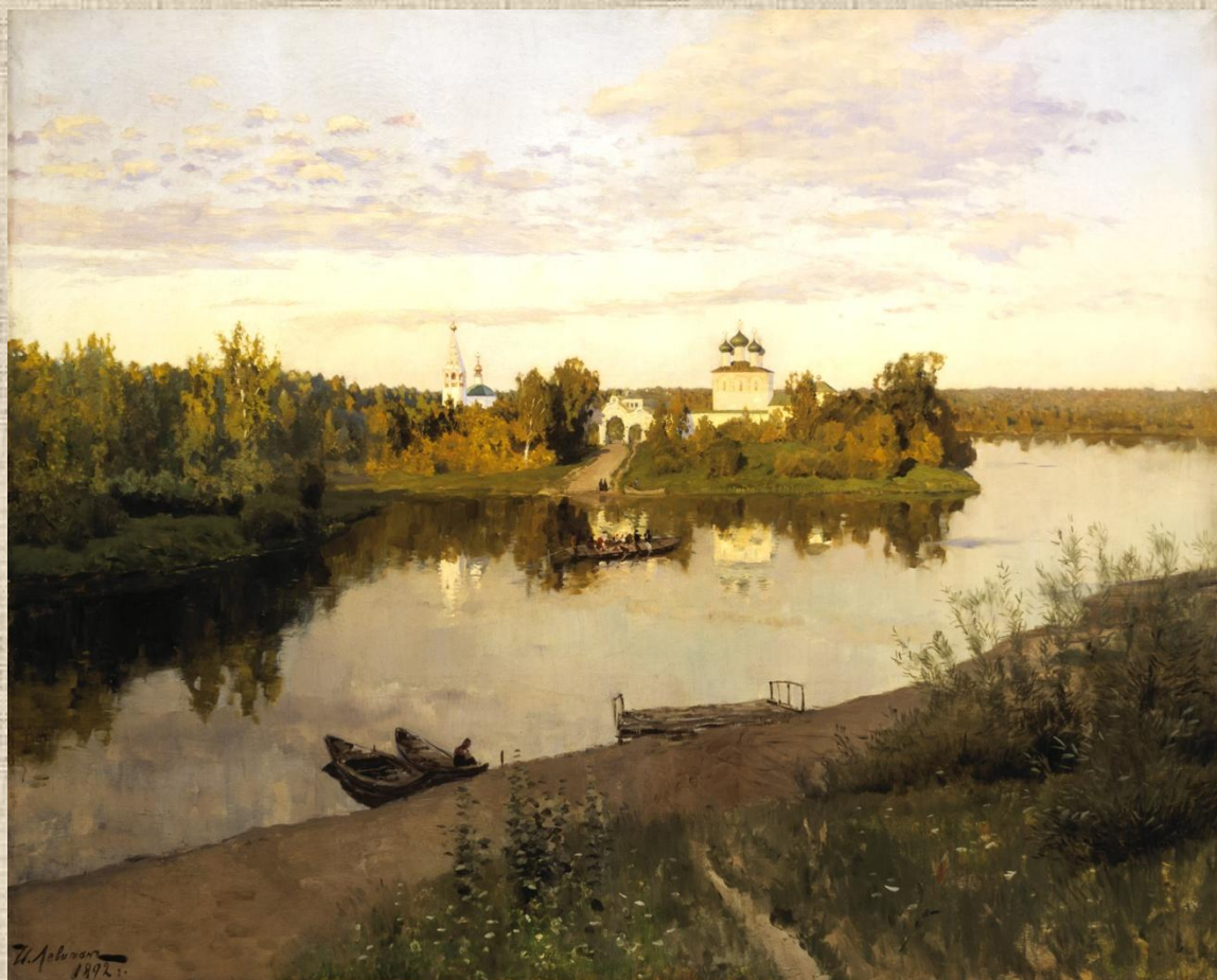
И.И.Левитан. Вечерний звон.