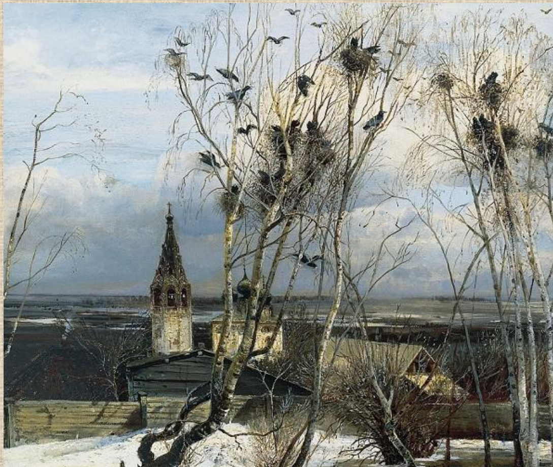
А.К.Саврасов. Грачи прилетели. Масло. Россия. XIXв.