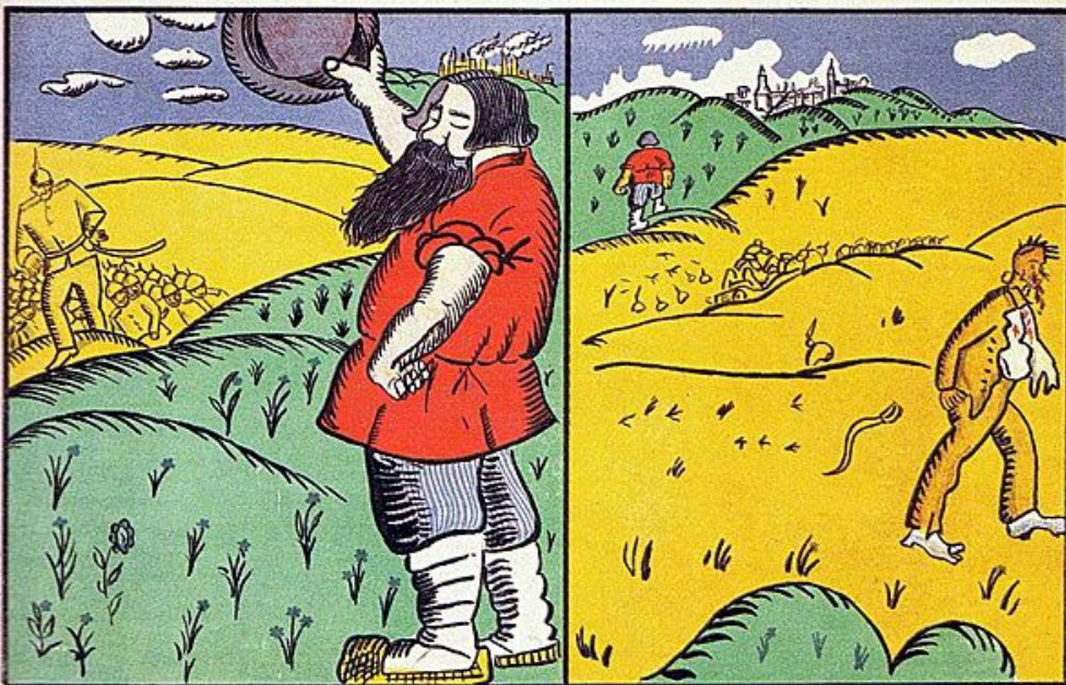
Подошелъ колбасникъ къ Лодзи Мы сназали „Панъ добродзи“