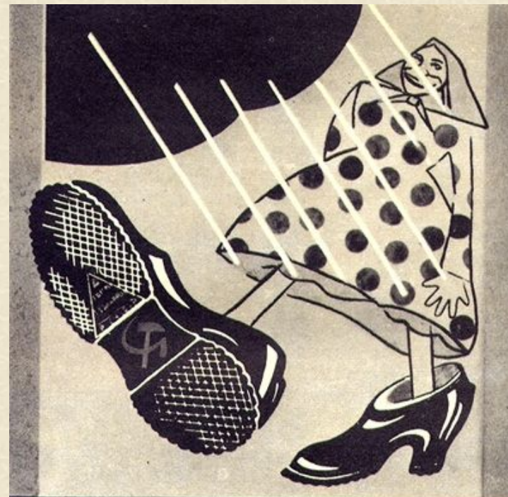
Ну, а съ Лодзью рядомъ Радомъ И ушелъ съ подбитымъ задомъ.

ДОЖДИК ДОЖДЬ ВПУСТЮ ЛЬЕШЬ Я НЕ ВЫЙДУ БЕЗ ГАЛОШ. С ПОМОЩЬЮ РЕЗИНОТРЕСТА МНЕ ВЕЗДЕ СУХОЕ МЕСТО. ПРОДАЖА ВЕЗДЕ www.a4format.ru