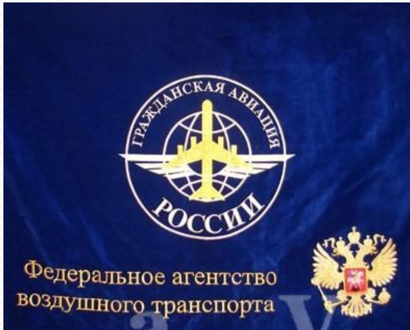
флаг гражданской авиации