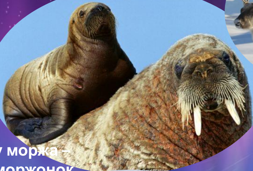
у моржа – моржонок