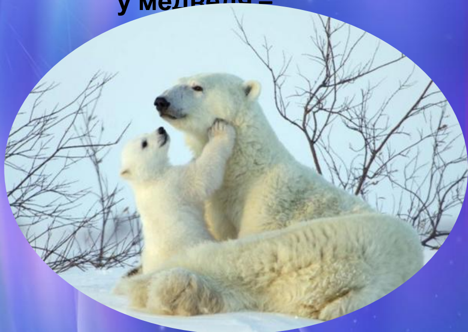
у медведя –