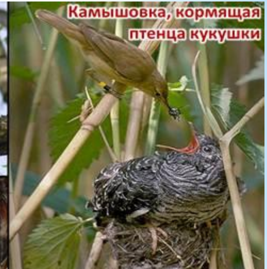
Камышовка, кормящая птенца кукушки