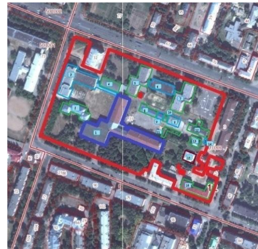
Корпус «№1», Общежитие №7