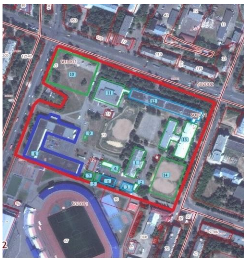
Корпуса «Б», «В», «Д», «Е»

Внимание! Красной линией обозначена территория МарГУ, где курение запрещено.