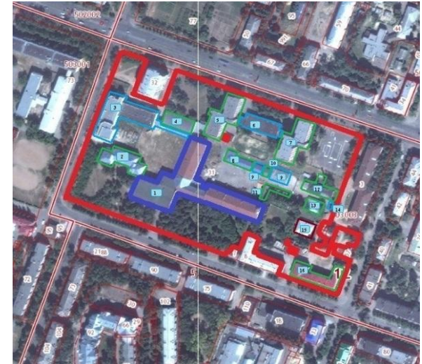
Общежития № 4, 5