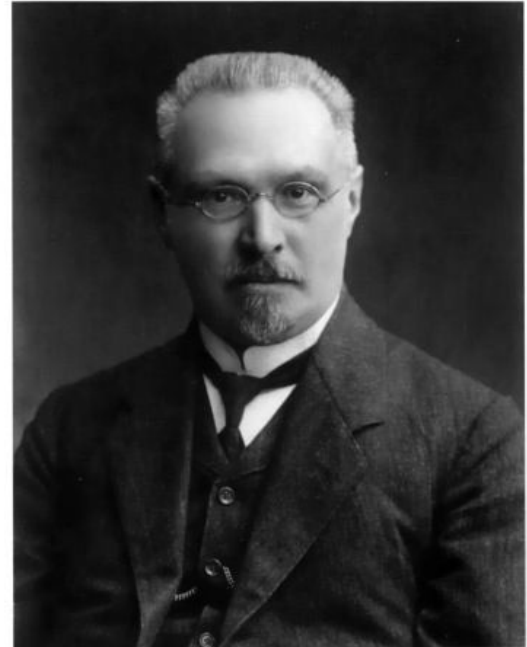
Сергей Федорович ПЛАТОНОВ (1860–1933) Фотография 1908 г.

Скрытой она остается и по сегодняшний день. Но, как бы то ни было, самозванец, воспользовавшись тайной помощью польского короля Сигизмунда III, набрал небольшое войско (по разным оценкам от 4 до 6 тыс. человек) и в октябре 1604 г. перешел границу Московского государства.