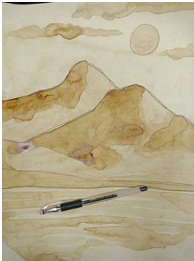
Рисунок в технике Кофеграфия на затонированной бумаге в формате А3 высыхает.

Когда работа высохнет, то приступаем к обводке всех деталей, нарисованных по образцу- черной гелевой ручкой.