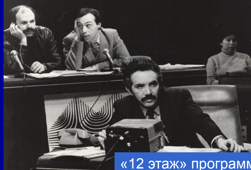
«12 этаж» программа Э. Сагалаева