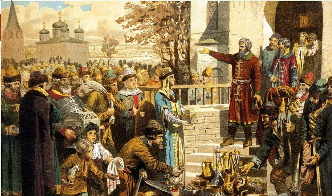
Воззвание Кузьмы Минина к нижегородцам. 1611 г. Художник А. Кившенко

Кто только не правил страной в этот страшный момент: Борис Годунов, Лжедмитрий I, Василий Шуйский, Семибоярщина, польский королевич Владислав, Лжедмитрий II, а за ним и Лжедмитрий III. Страна и народ были измучены до такой степени, что заговорили о крахе России и её разрушении. К счастью, патриарх Гермоген призвал народ встать на защиту веры и Отечества и изгнать оккупантов. Ополчение возглавили земский староста Кузьма Минин и князь Дмитрий Пожарский. Благодаря всеобщему единению народа польских захватчиков удалось прогнать с русской земли.