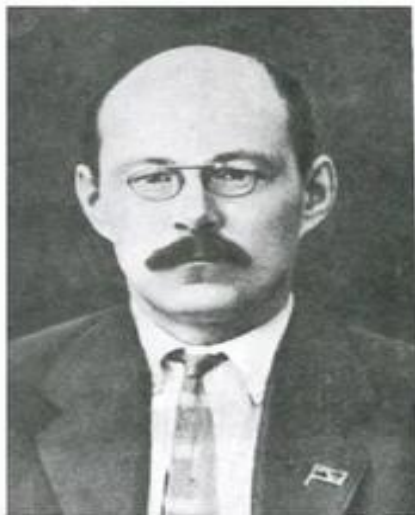
Наговицын Иосиф Алексеевич (1888 – 1937)

4 ноября 1920 г. Постановление о создании подписано Председателем ВЦИК М.И. Калининым и Председателем СНК РСФСР В.И. Лениным.