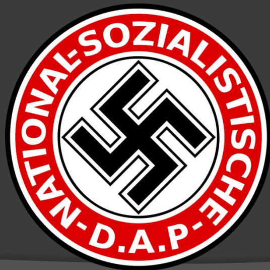
Процент проголосовавших за НСДАП на парламентских выборах в Германии

В условиях экономического кризиса и усиливавшейся классовой борьбы господствующие классы Германии склонялись к мнению, что буржуазно-демократические методы управления страной становятся непригодными. Ставка была сделана на фашистскую партию, которая официально называлась Национал социалистической рабочей партией Германии.