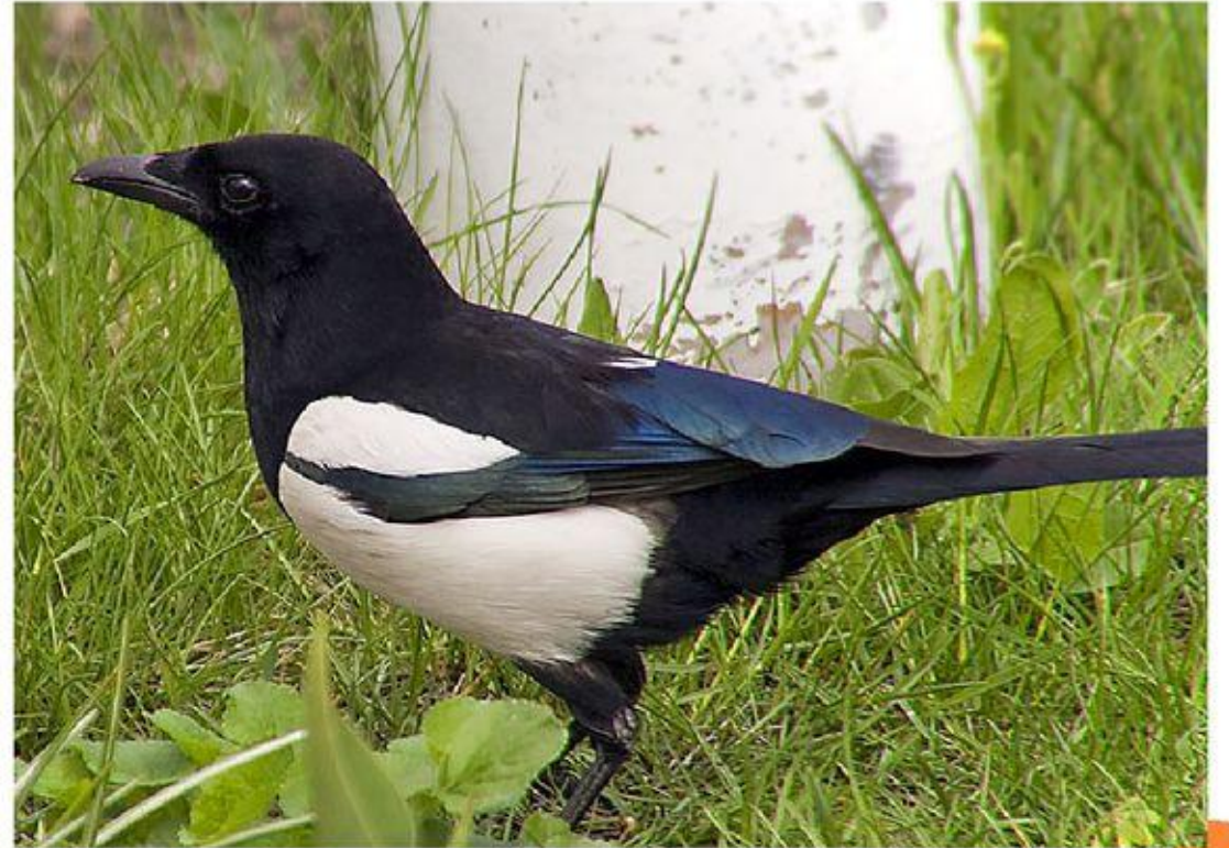
Обыкновенная сорока,(лат. Pica pica )