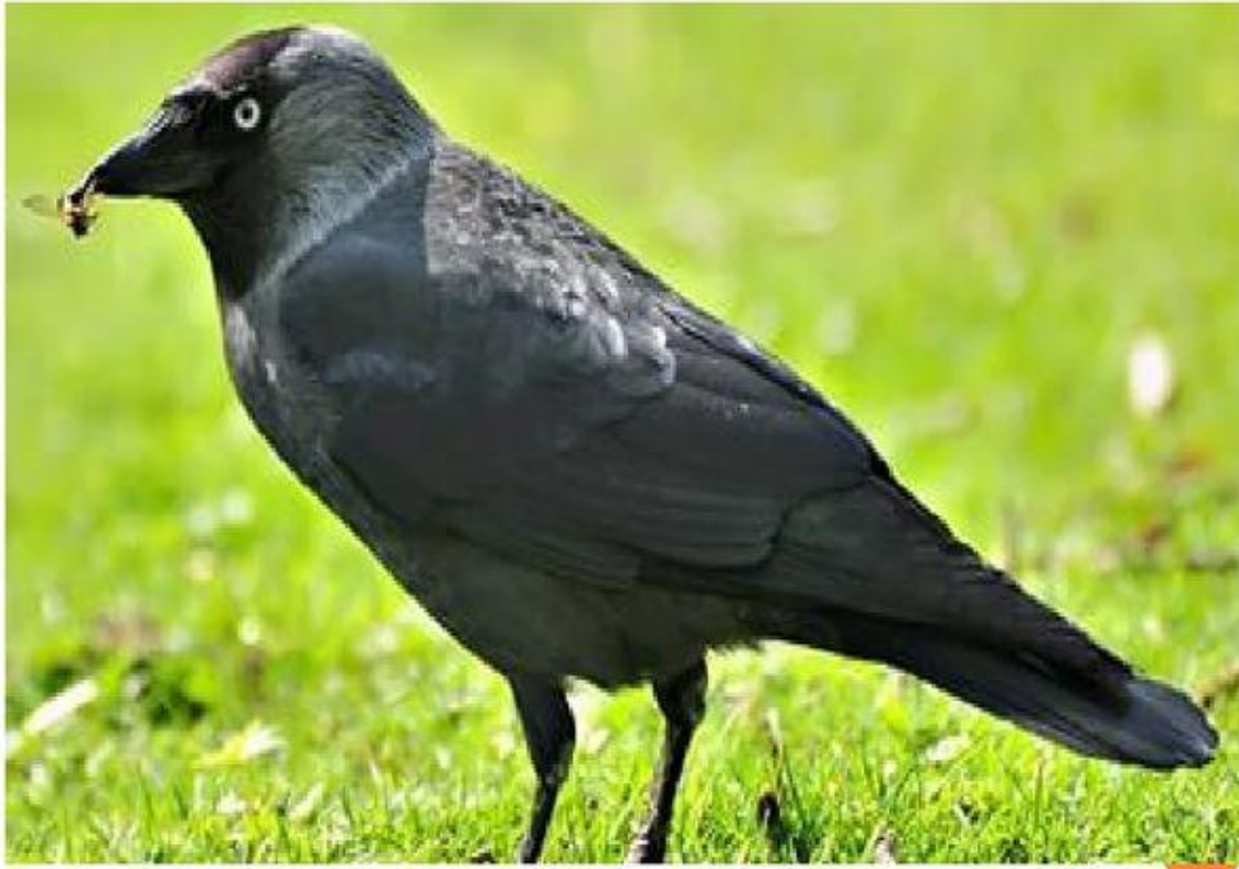
Ворона ( Corvus corax )