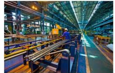
Прессовое и кузнечное производство | А... amrbk.ru