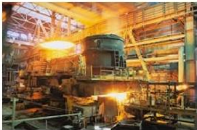
Производство - общая характеристика и ... grandars.ru