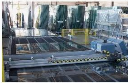
Производство стеклопакетов в Москве – Заво...