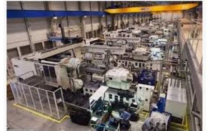
Производство пластмассовых изделий