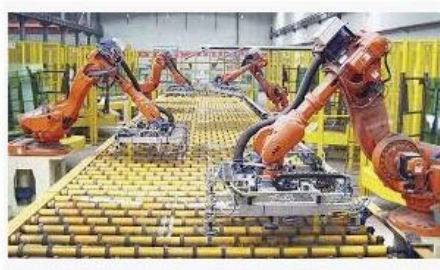
Цифровое производство, мониторинг и искусство...