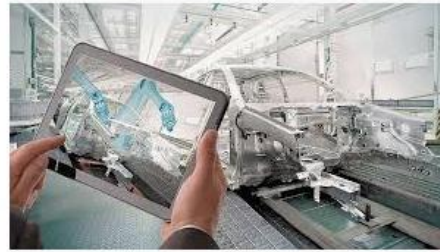
Цифровое производство | Группа компаний "ПЛ... plm-ural.ru