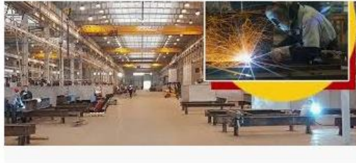
Производство чернометаллических конструкций - «Ди... diferro.ru