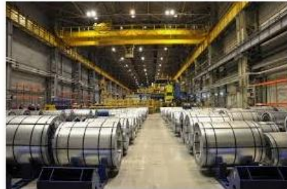
В 2018 г. производство готового проката в РФ...