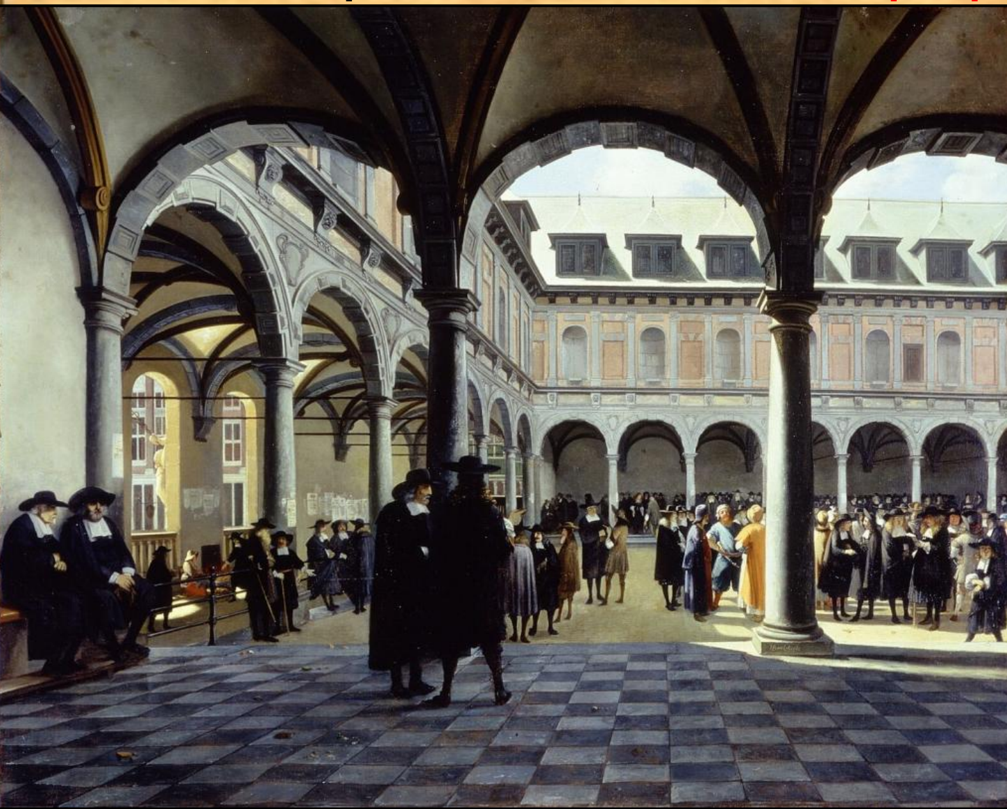
Двор Амстердамской биржи (худ. Иов Беркхейде)

Постепенно появлялись биржи – место купли/продажи товаров, главным образом оптовой. Со Средних веков сохраняли своё значение и ярмарки .