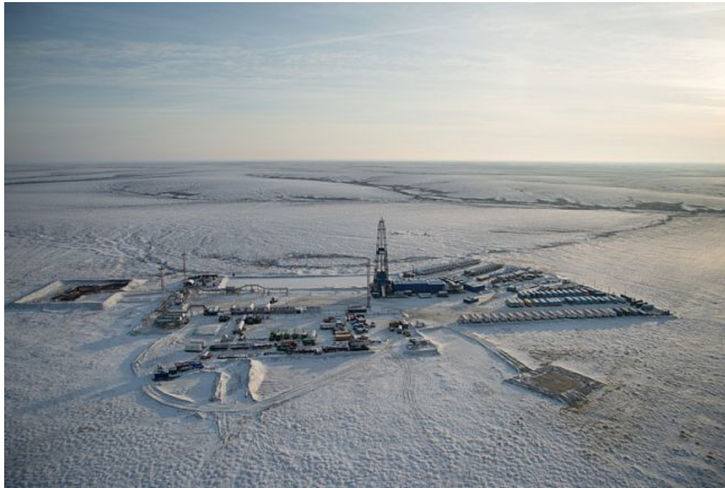
2015 – начало эксплуатационного бурения