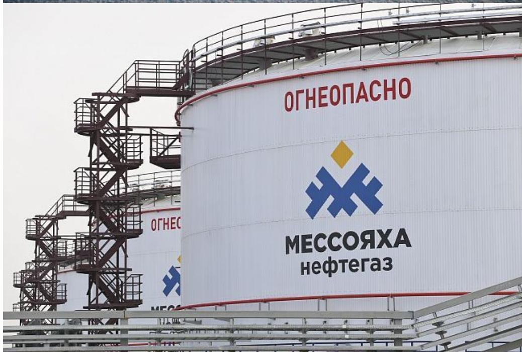
21 сентября 2016 – Ввод в эксплуатацию Востно-Мессояхского месторождения