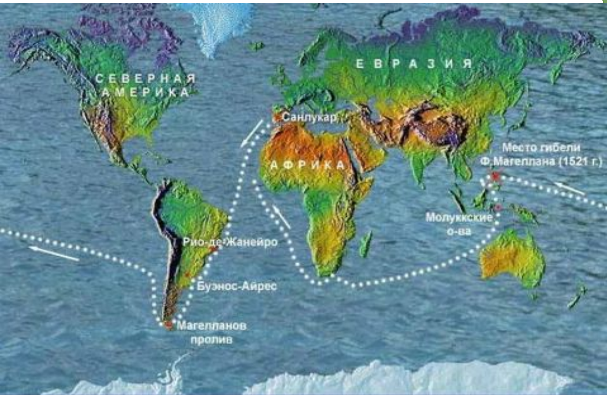
Первая кругосветная экспедиция Ф. Магеллана. 1519-1522 гг.