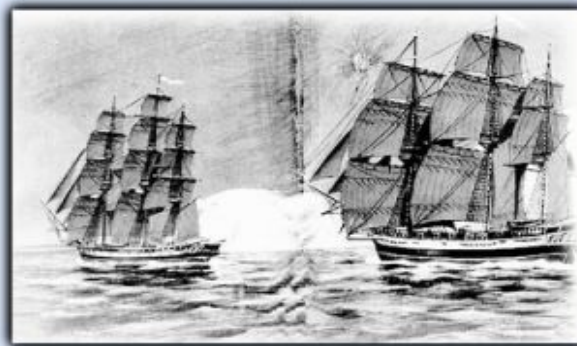
Шлюпы Восток и Мирный