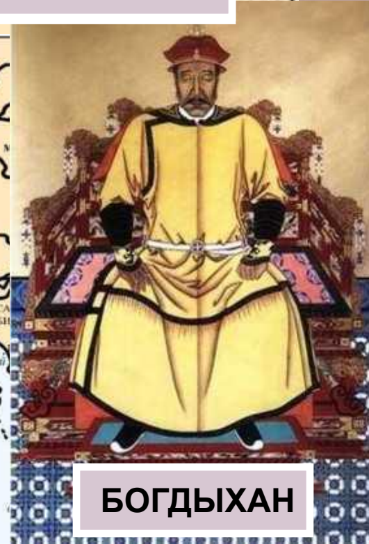
БОГДЫХАН первый император династии ЦИН