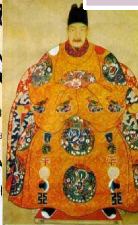
последний император династии МИН