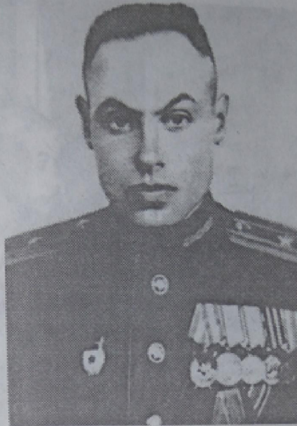
Военная академия им. М.В. Фрунзе 1948 – 1951 гг.