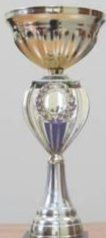
БОЖИЧКИН КУБОК г. Якутск