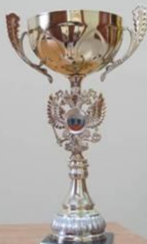
Войдатыло Серебряный кубок за победу в конкурсе «Учитель года»