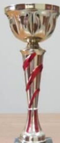
Александров Серебряный кубок за победу в конкурсе «Учитель года»