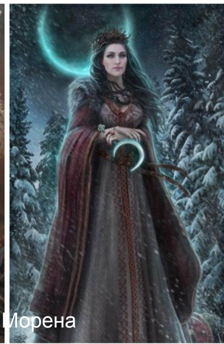
Велес и Морена