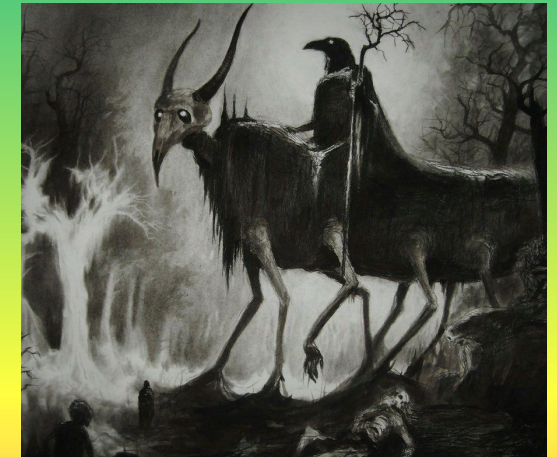
Черная немочь – злобный дух, который нападает на домашний скот и выпивает из него жизнь.