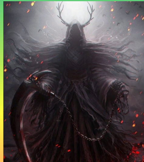
Мор – божество смерти и несчастий.