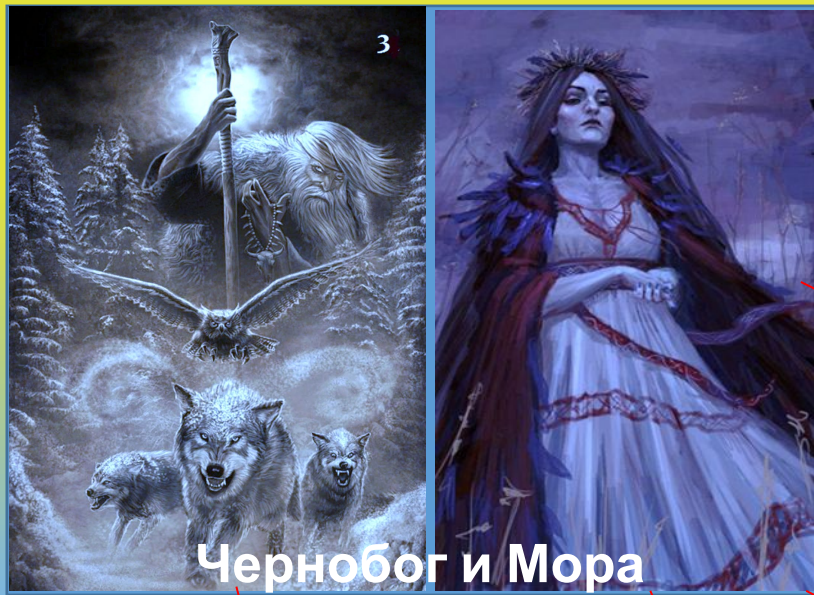
Чернобог и Мора