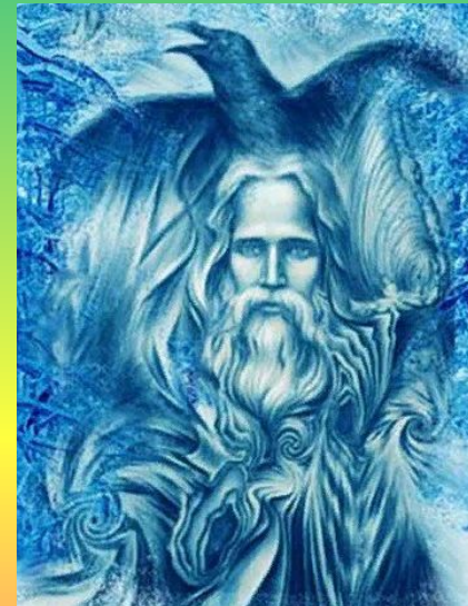
Морок – бог лжи, обмана, заблуждения, бог иллюзий.