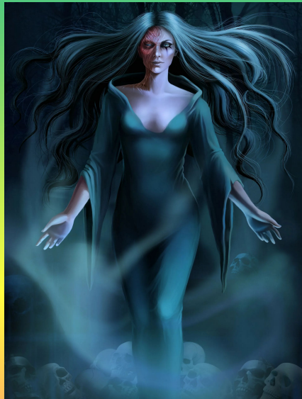
Мста – богиня мести.

Лихоманки – злые сестры, которые были предвестниками болезней. 12 сестёр каждая отвечала за определённый вид болезней как на физическом уровне, так и на душевном.