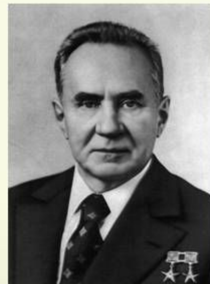
А.Н.Косыгин, Председатель Совета Министров СССР