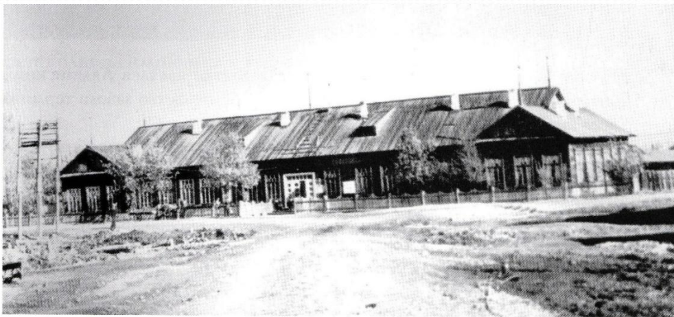
Контора Ляминского ДСК