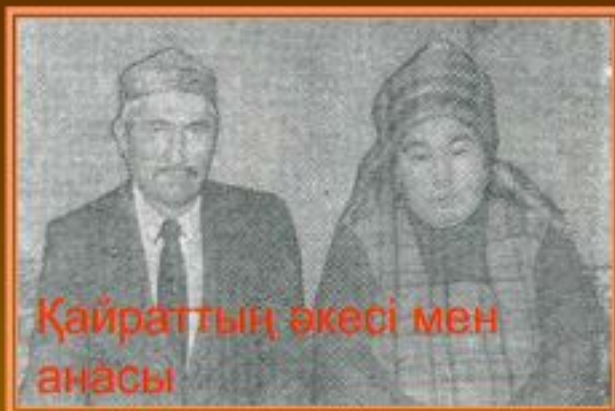
Қайраттың әкесі мен анасы