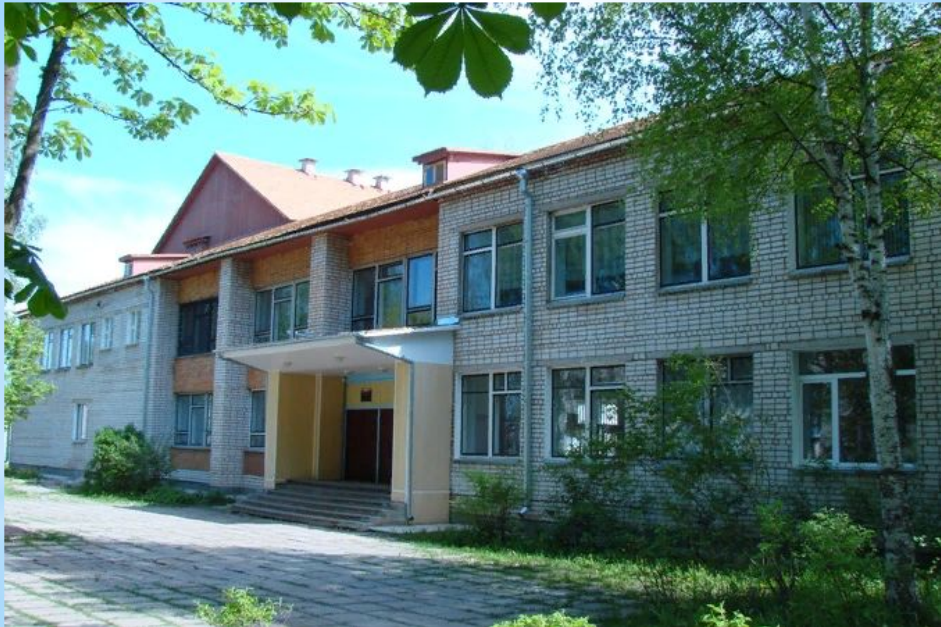
Муниципальное общеобразовательное учреждение "Переслегинская гимназия"