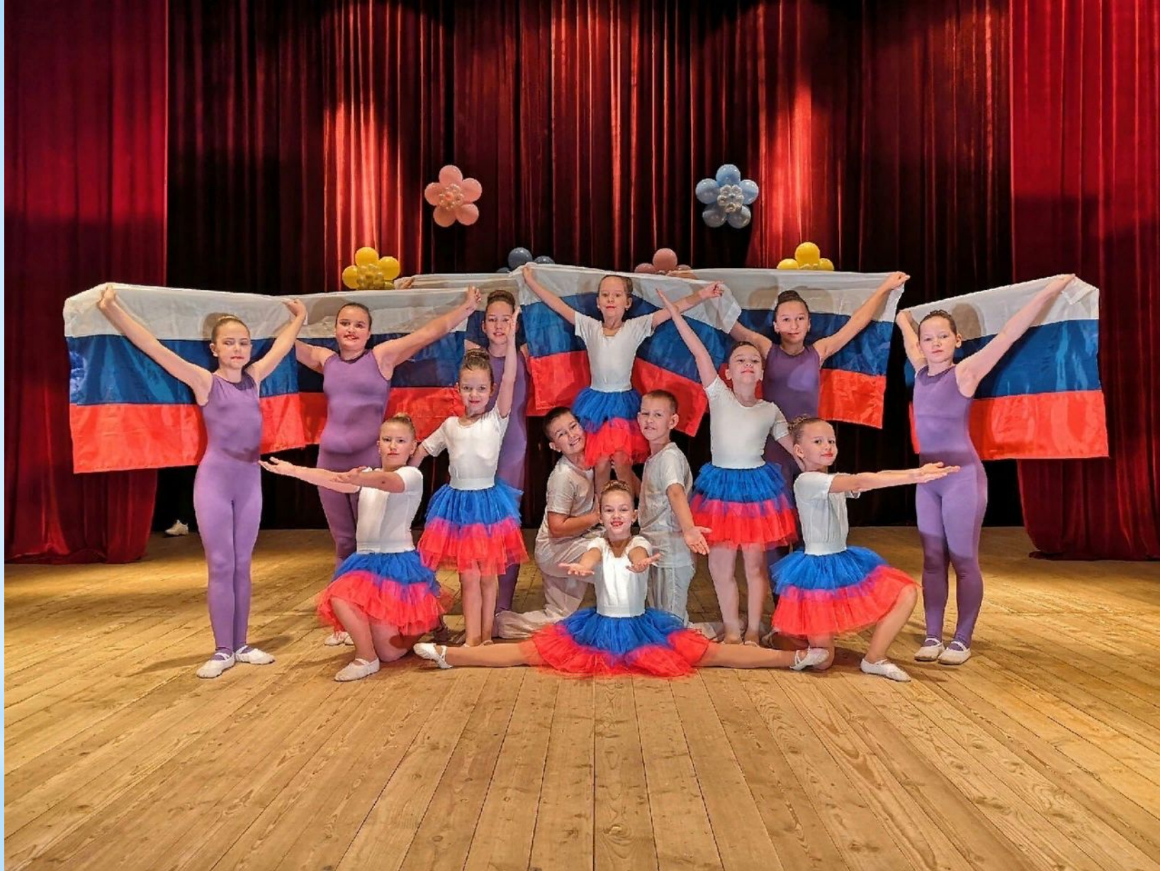
Танцевальный коллектив «Улыбка»