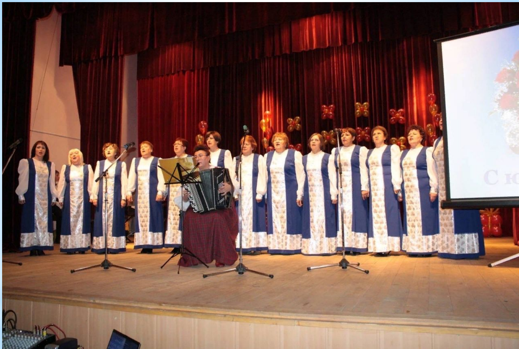
Народный хор русской песни «Ивушка»