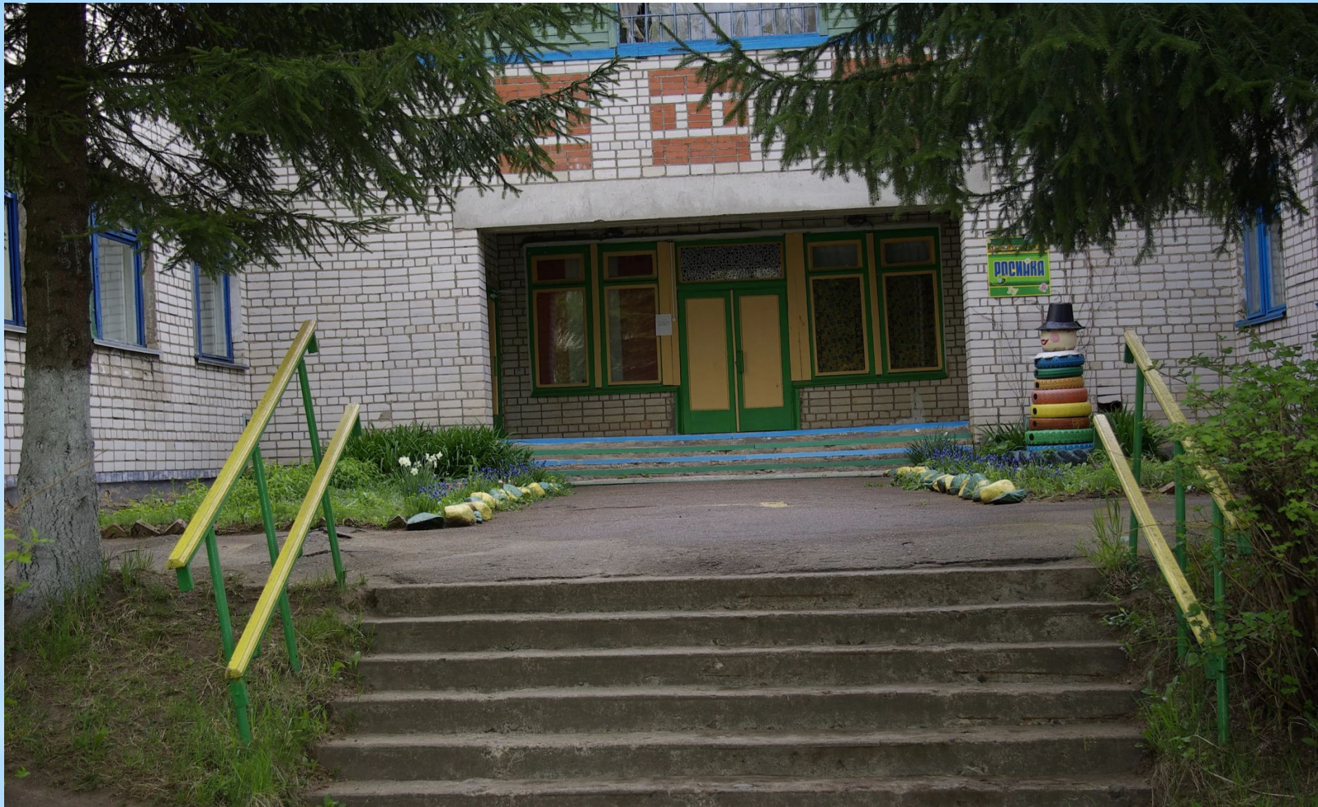
Детский сад "Росинка", филиал муниципального общеобразовательного учреждения "Переслегинская гимназия", д.Переслегино