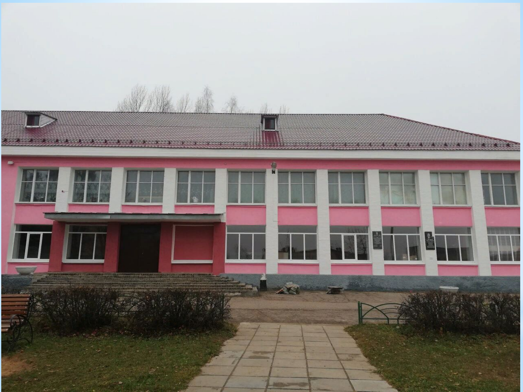
Переслегинский Дом культуры