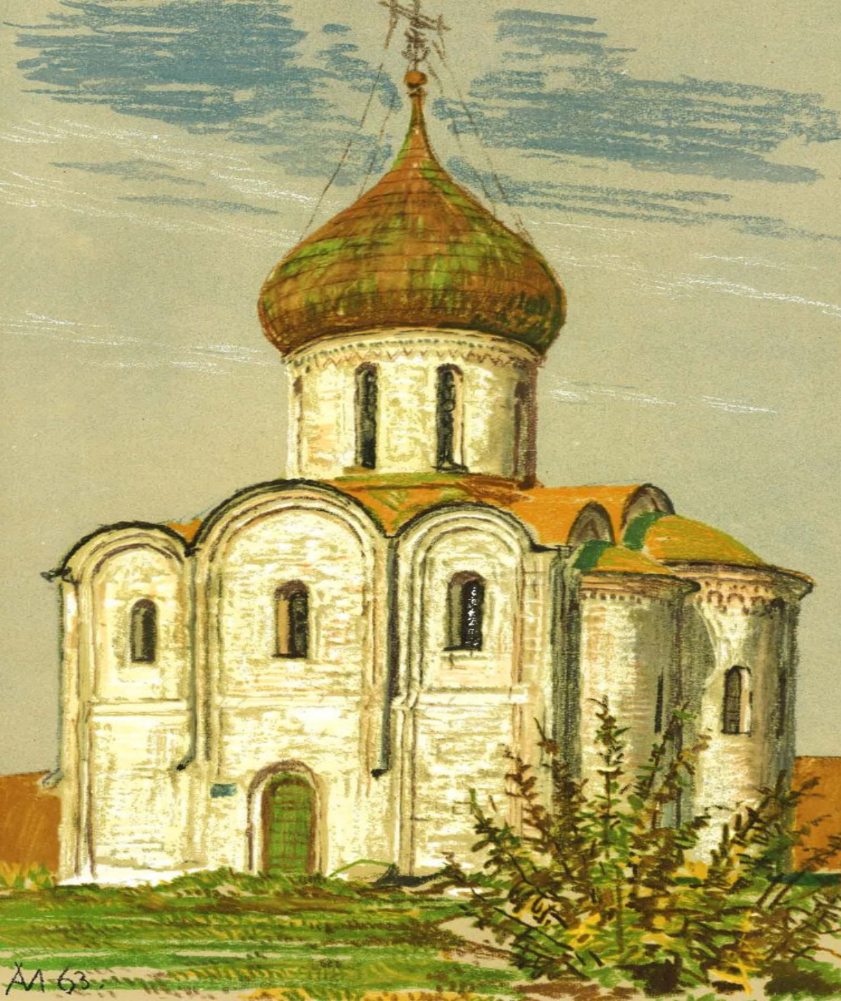
Переславль-Залесский. Свято-Преображенский собор. 1152 – 1157.