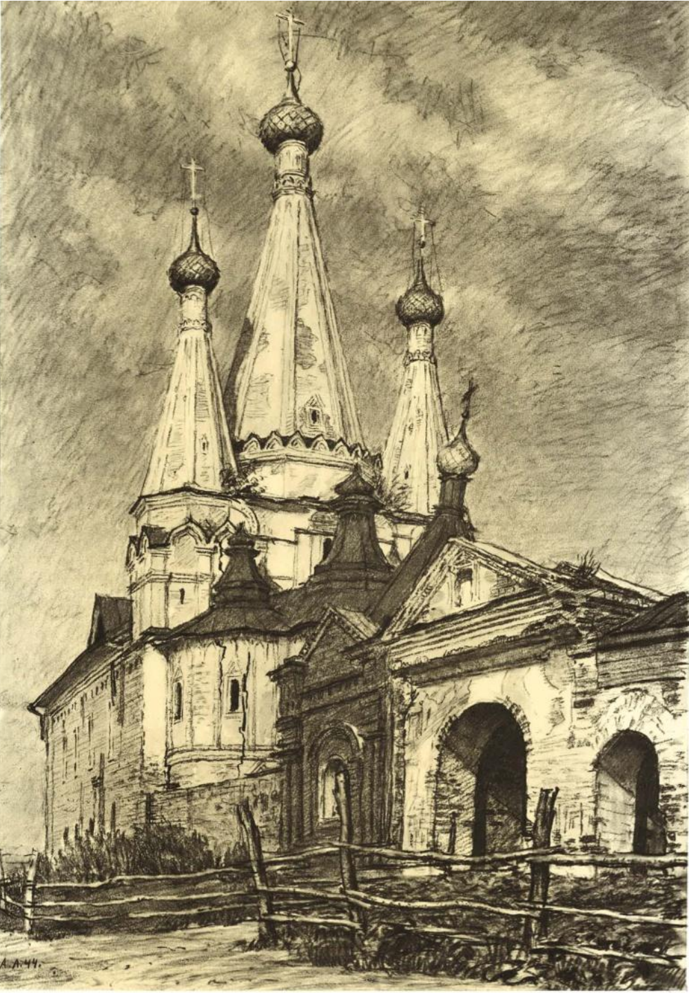
Алексеевский монастырь в Угличе. Успенская (Дивная) церковь. 1628