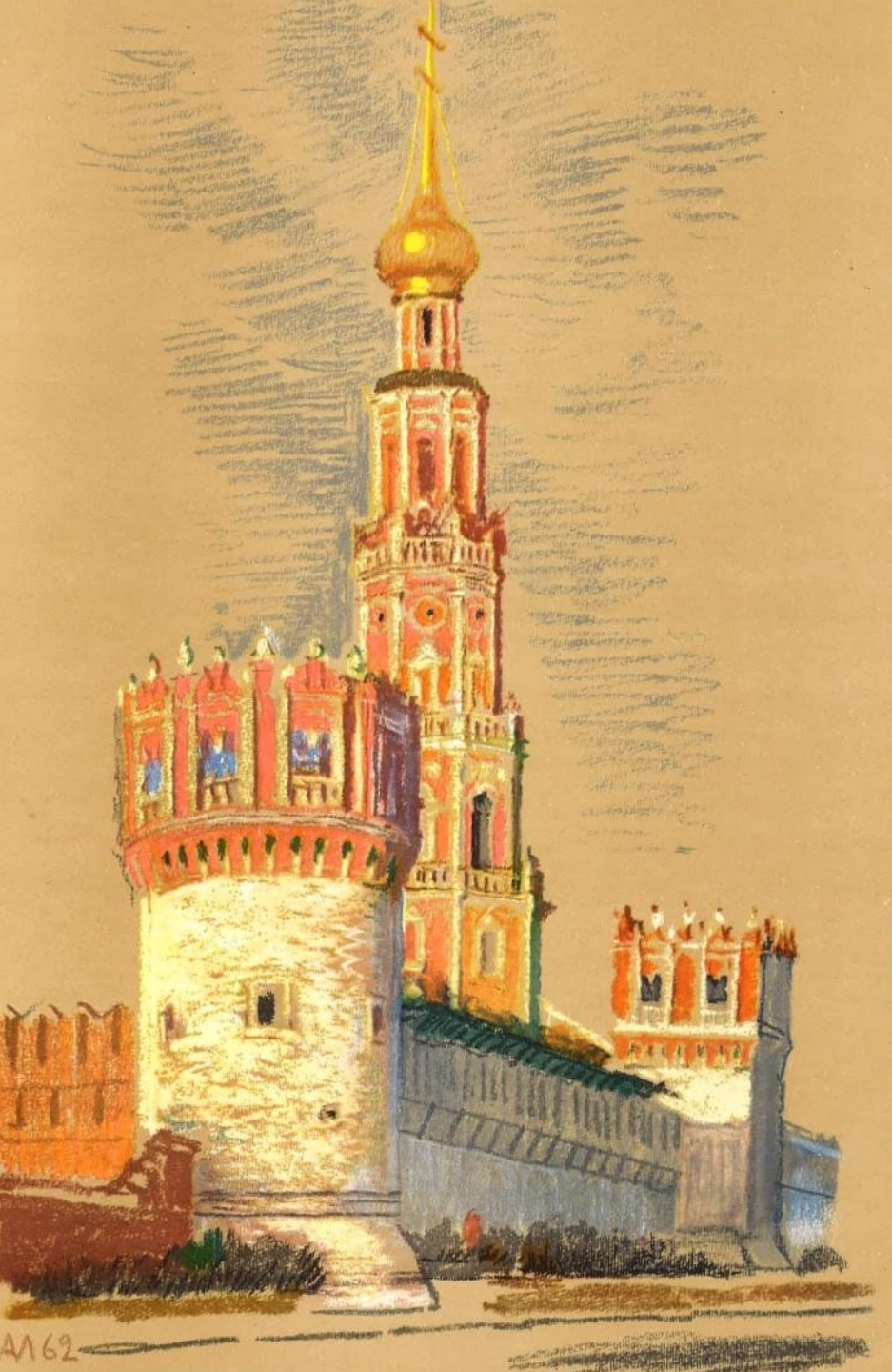
Новодевичий монастырь в Москве. Башни XVI в. (перестроены в 80-х гг. XVII в.). Колокольня.