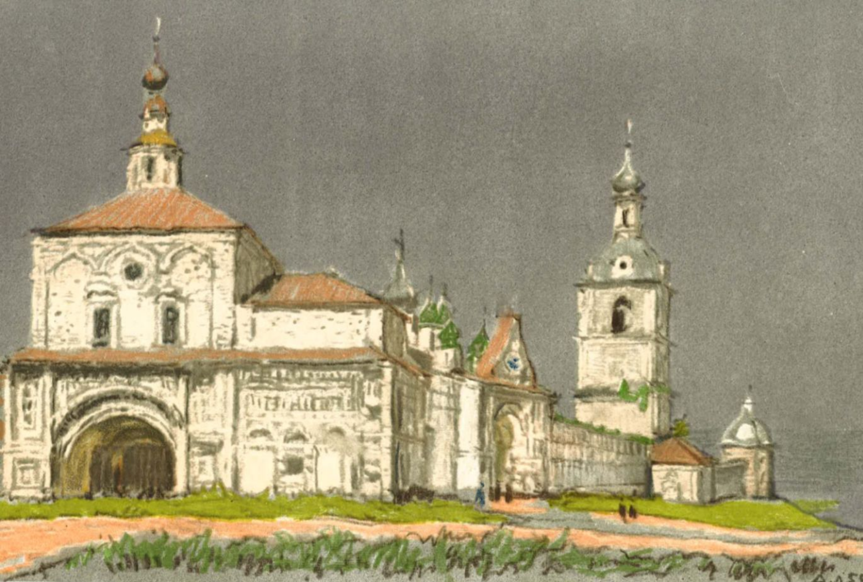
Переславль-Залесский. Проездные ворота и стены Горницкого монастыря. 1630-е годы