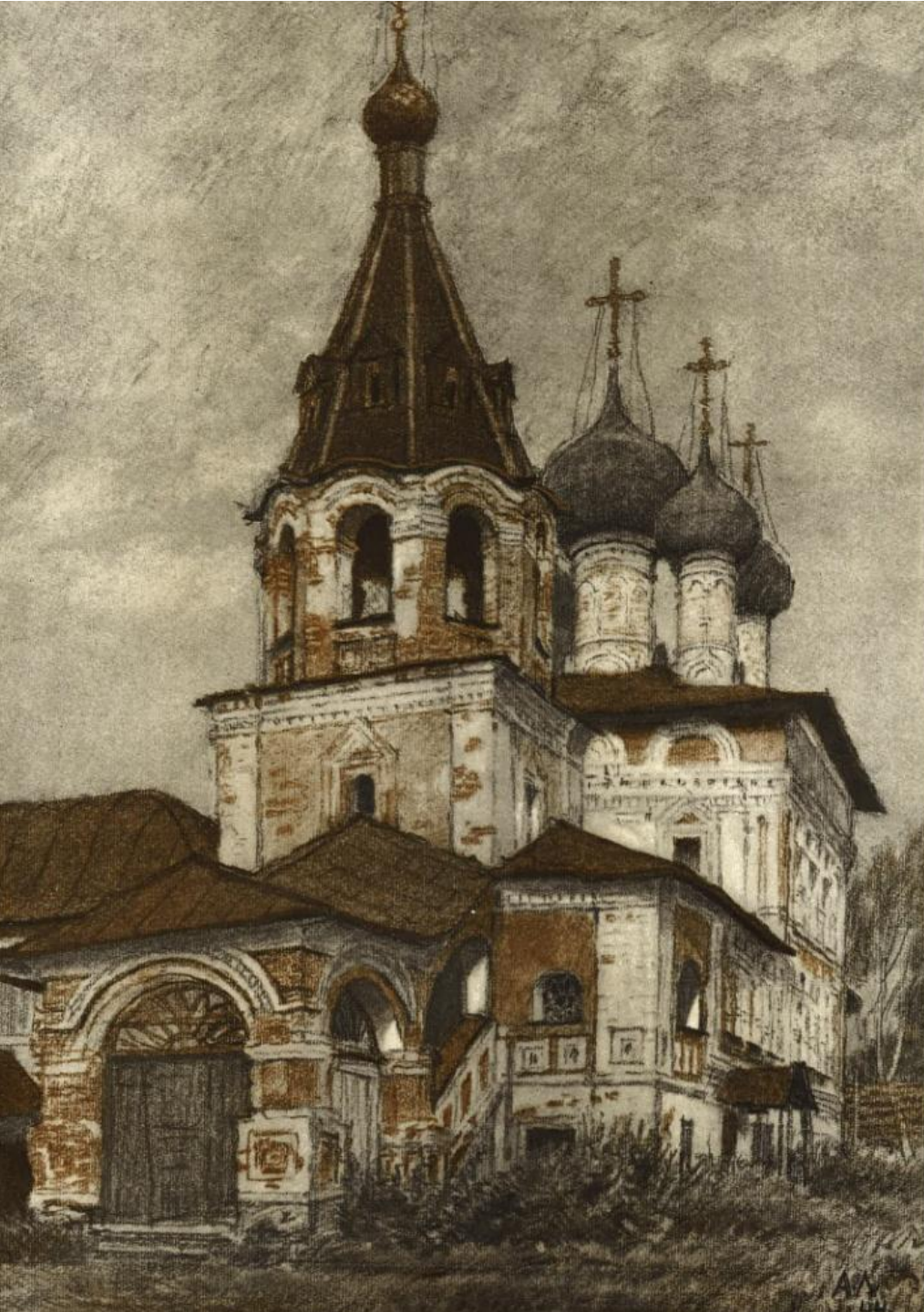
Угличский кремль. Церковь Димитрия «на крови». 1692