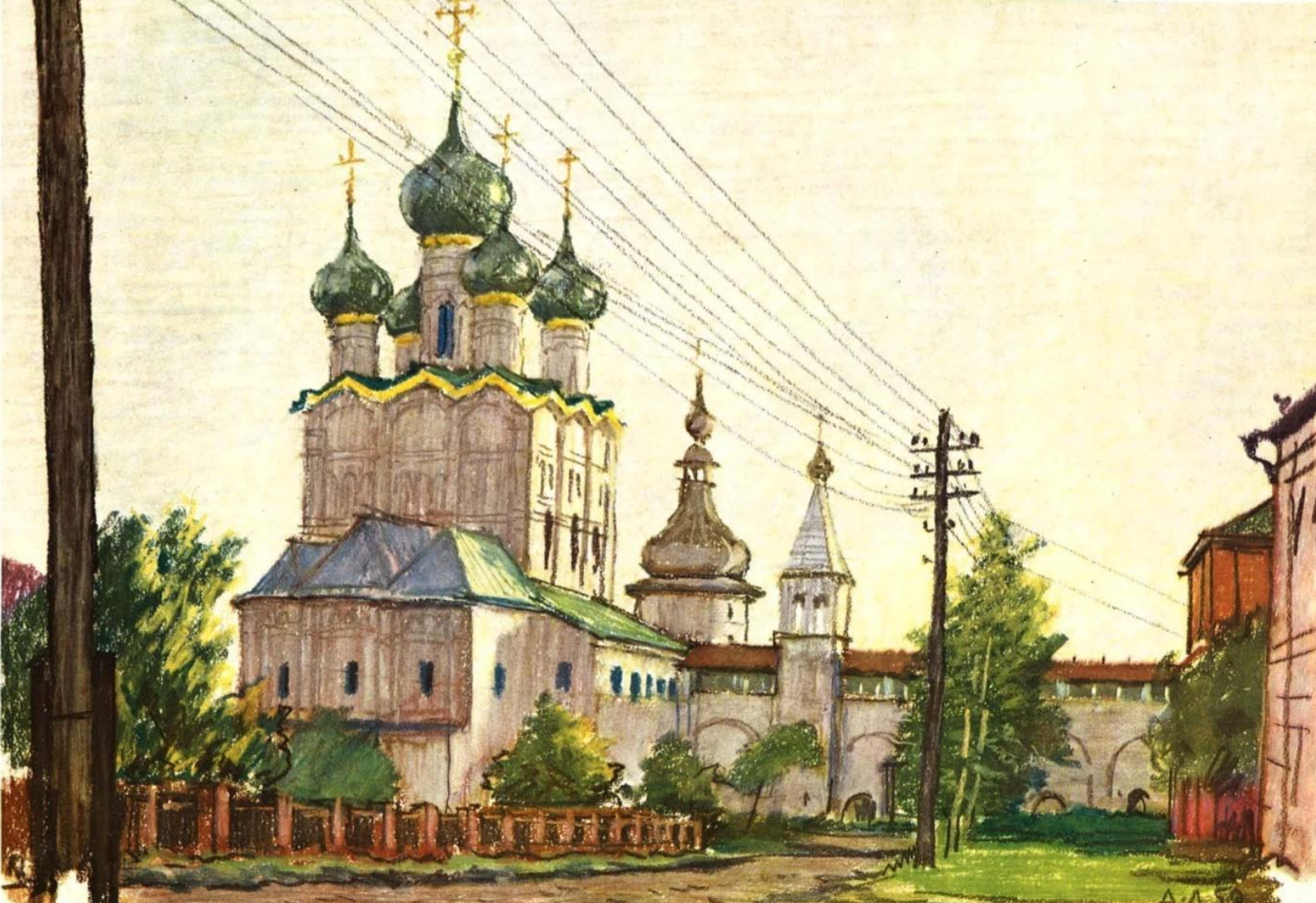
Ростов Великий. Церковь Иоана Богослова “на воротах” 1683