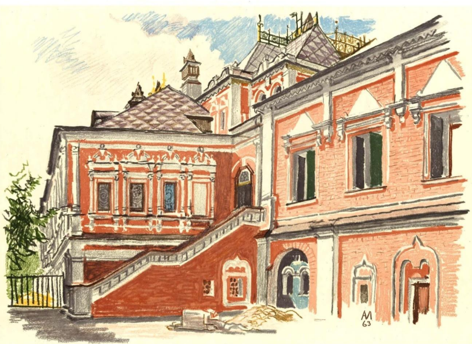
Москва. Юсуповский дворец (первоначально палаты боярина Волкова). Конец XVII в.