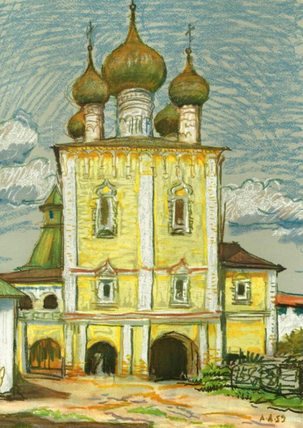
Борисоглебский монастырь близ Ростова Великого. Сретенская надвратная церковь. 1680