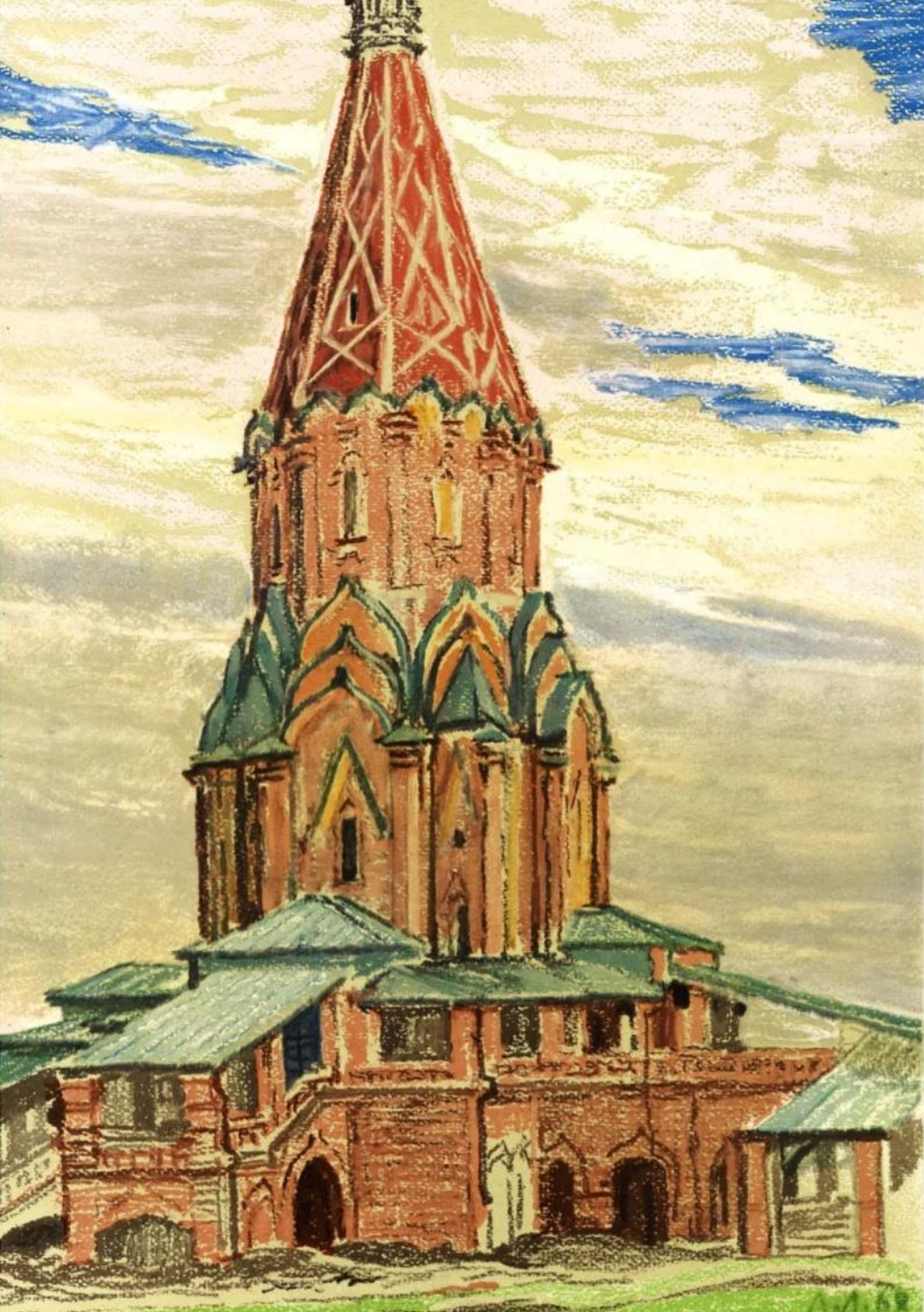
Село Коломенское близ Москвы. Церковь Вознесения. 1532