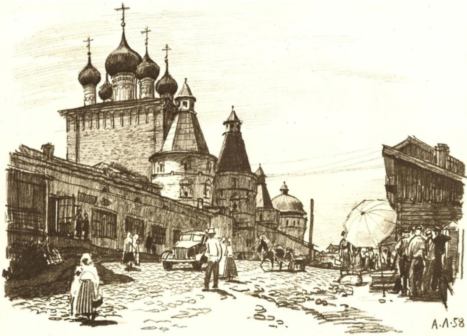
Борисоглебский монастырь близ Ростова Великого. Северные ворота и Сретенская надвратная церковь.