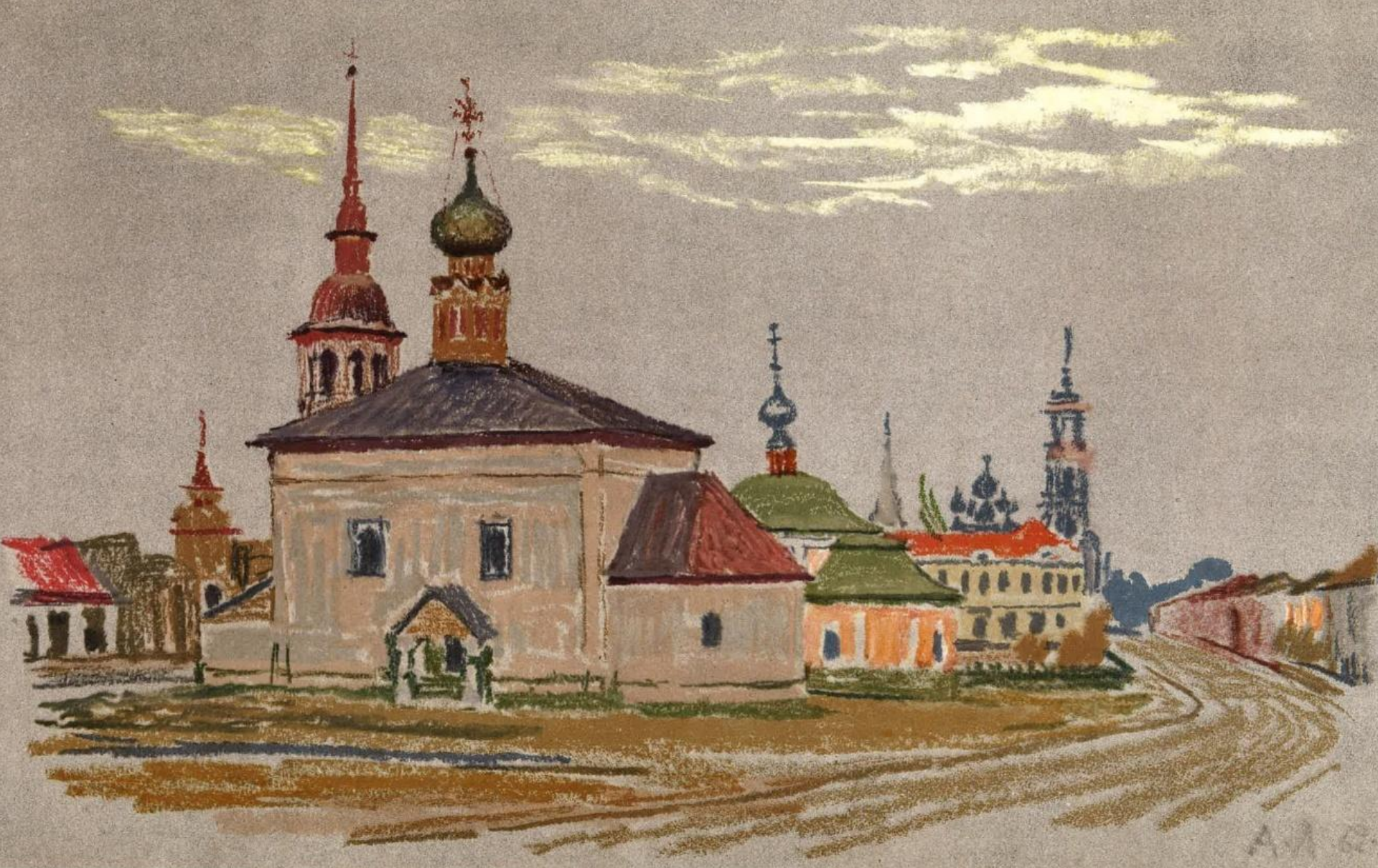
Суздаль. Церковь Воскресения. 1720