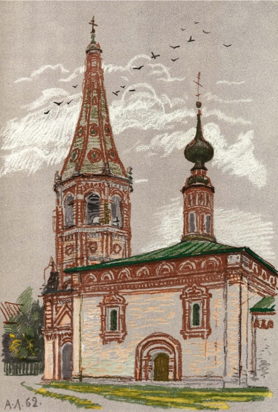
Суздаль. Никольская церковь. 1720 – 1739