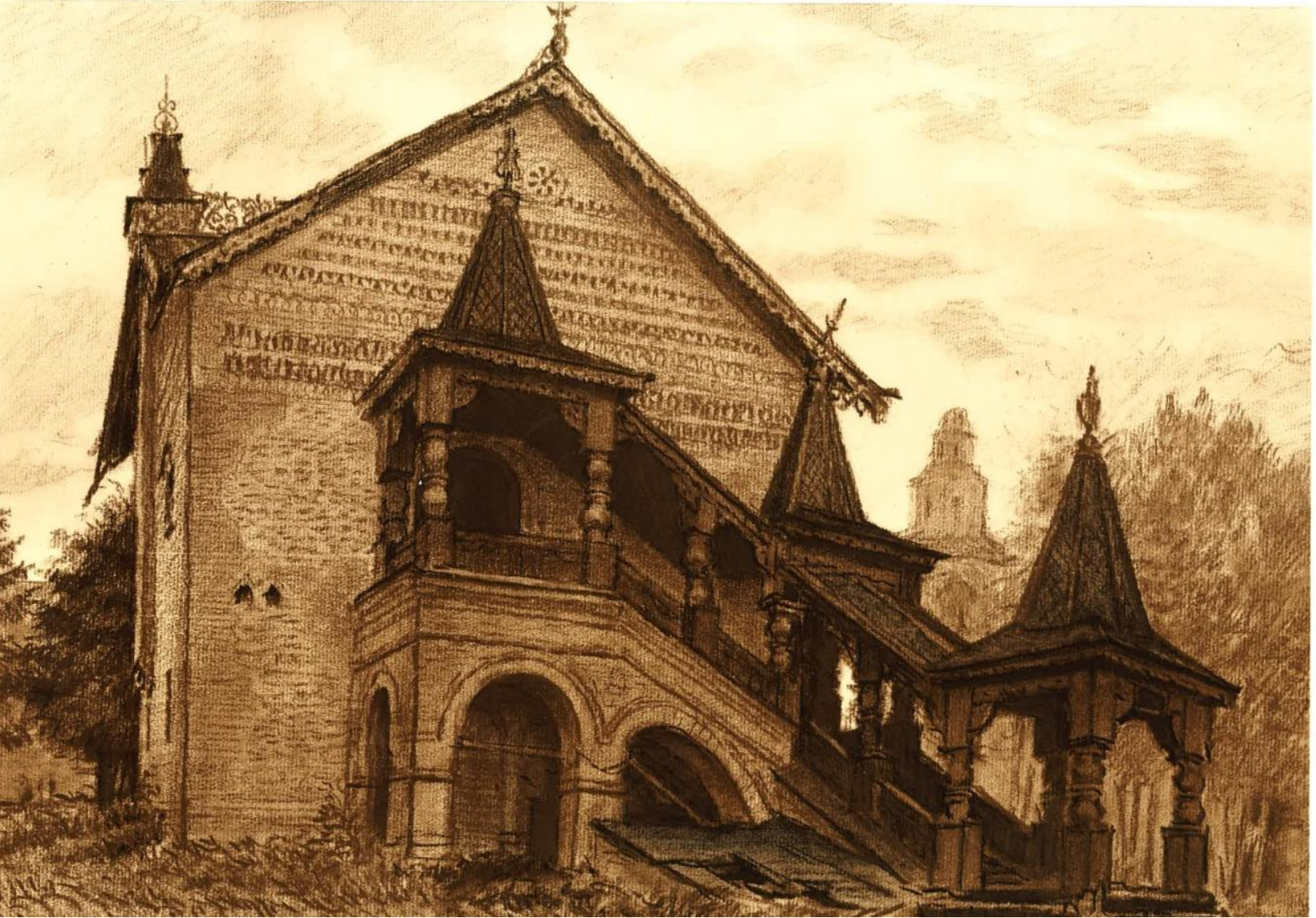
Углич. Каменные палаты (Дворец царевича Димитрия). 1482