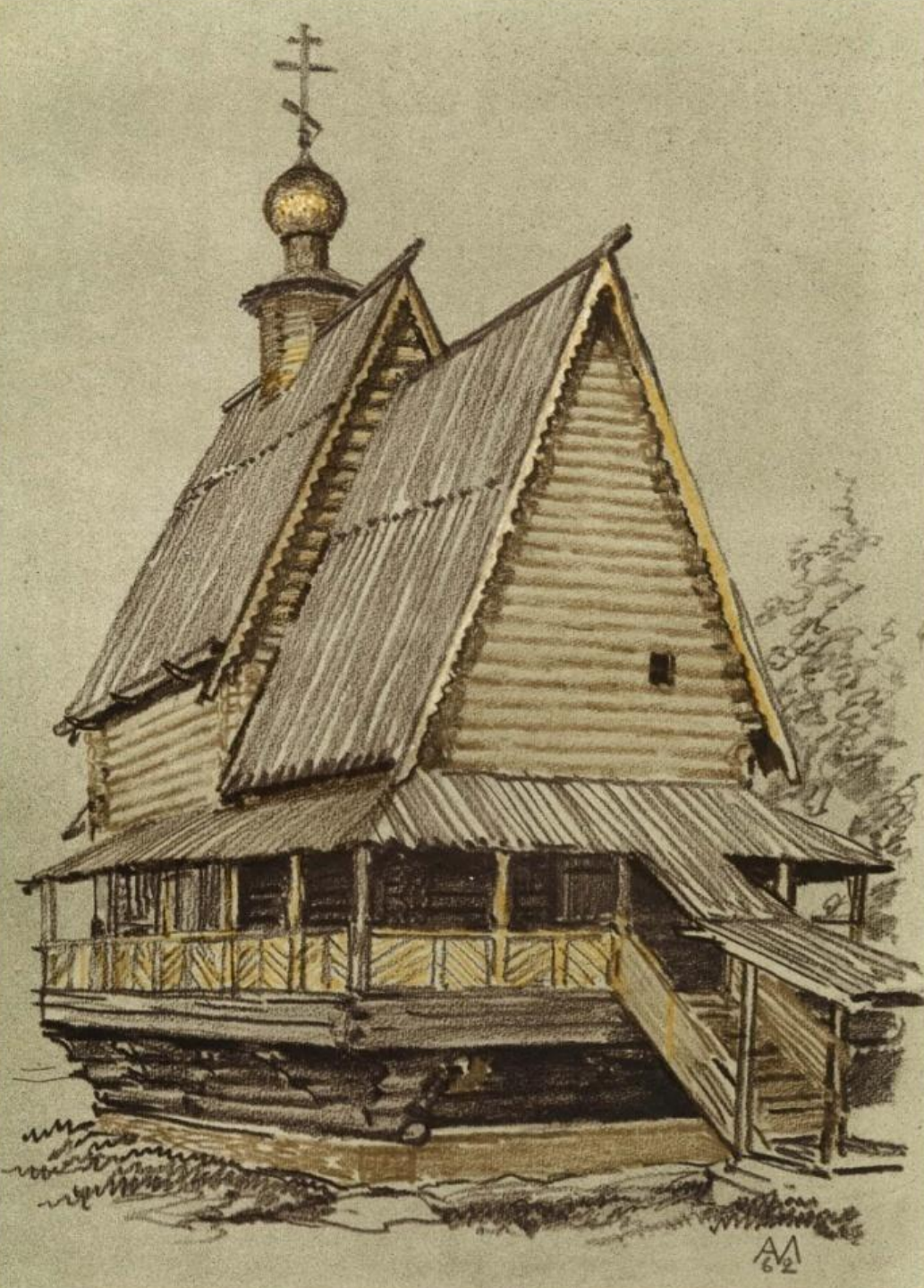
Суздаль. Церковь Николы из села Глотова. 1766