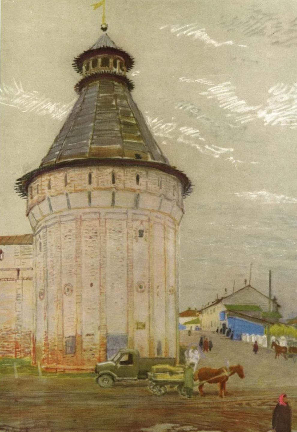
Борисоглебский монастырь близ Ростова Великого. Дозорная башня. Первая половина XVI в.