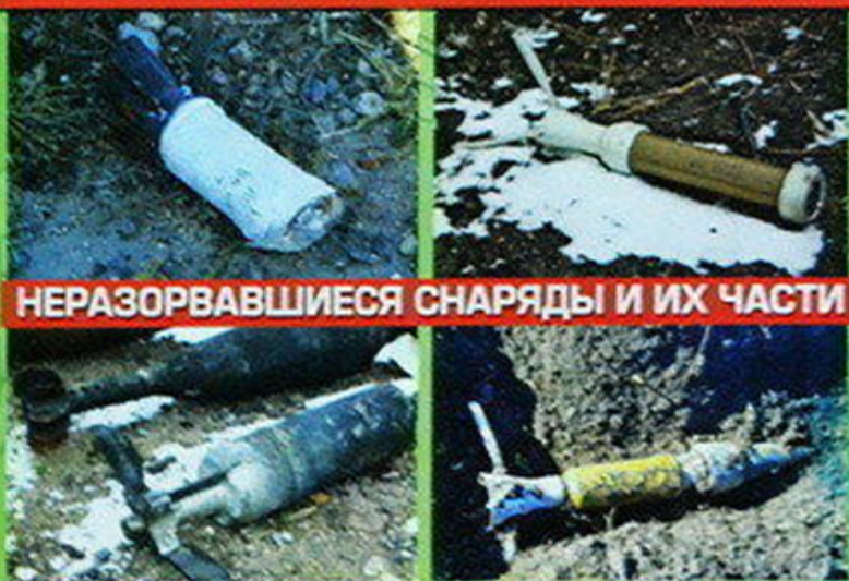
НЕРАЗОРВАВШИЕСЯ СНАРЯДЫ И ИХ ЧАСТИ