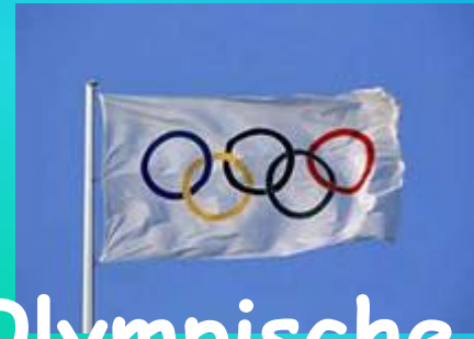
Die Olympische Flagge