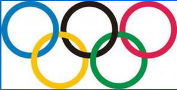
Die farbigen Ringe