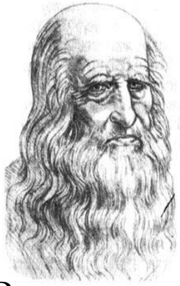
Леонардо да Винчи