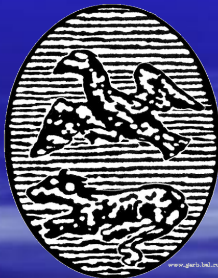
Герб Белгородской губернии (создан: Белгородский и Киевский губернии). XVIII век.

При губернаторе Трубецком был утвержден первый белгородский губернский герб, удостоенный "высочайшей апробации" 3 марта 1730 года.