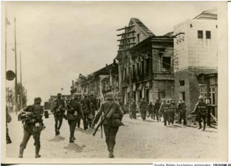
Größe Bilder kostenlos einbinden: Trixum.de