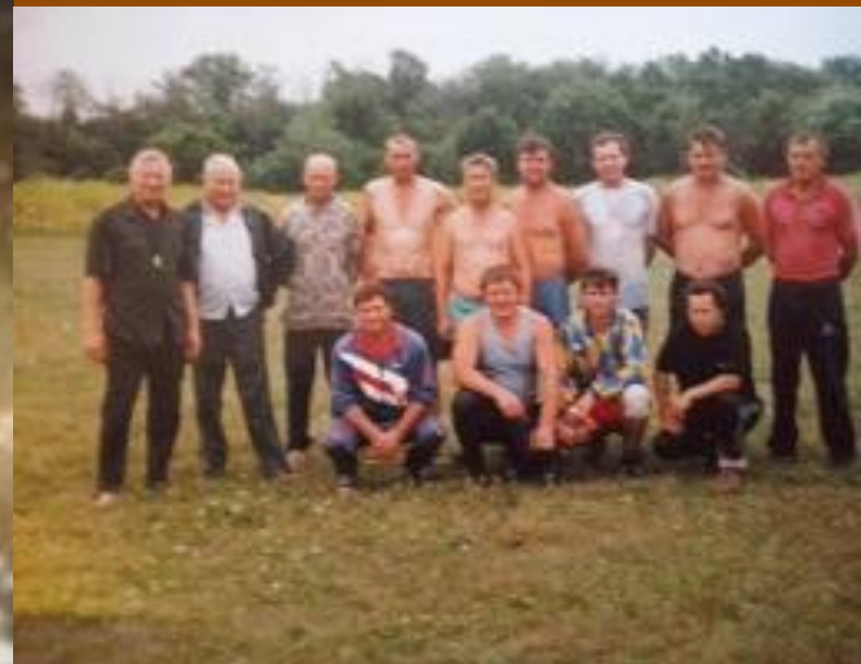
Соревнования по футболу