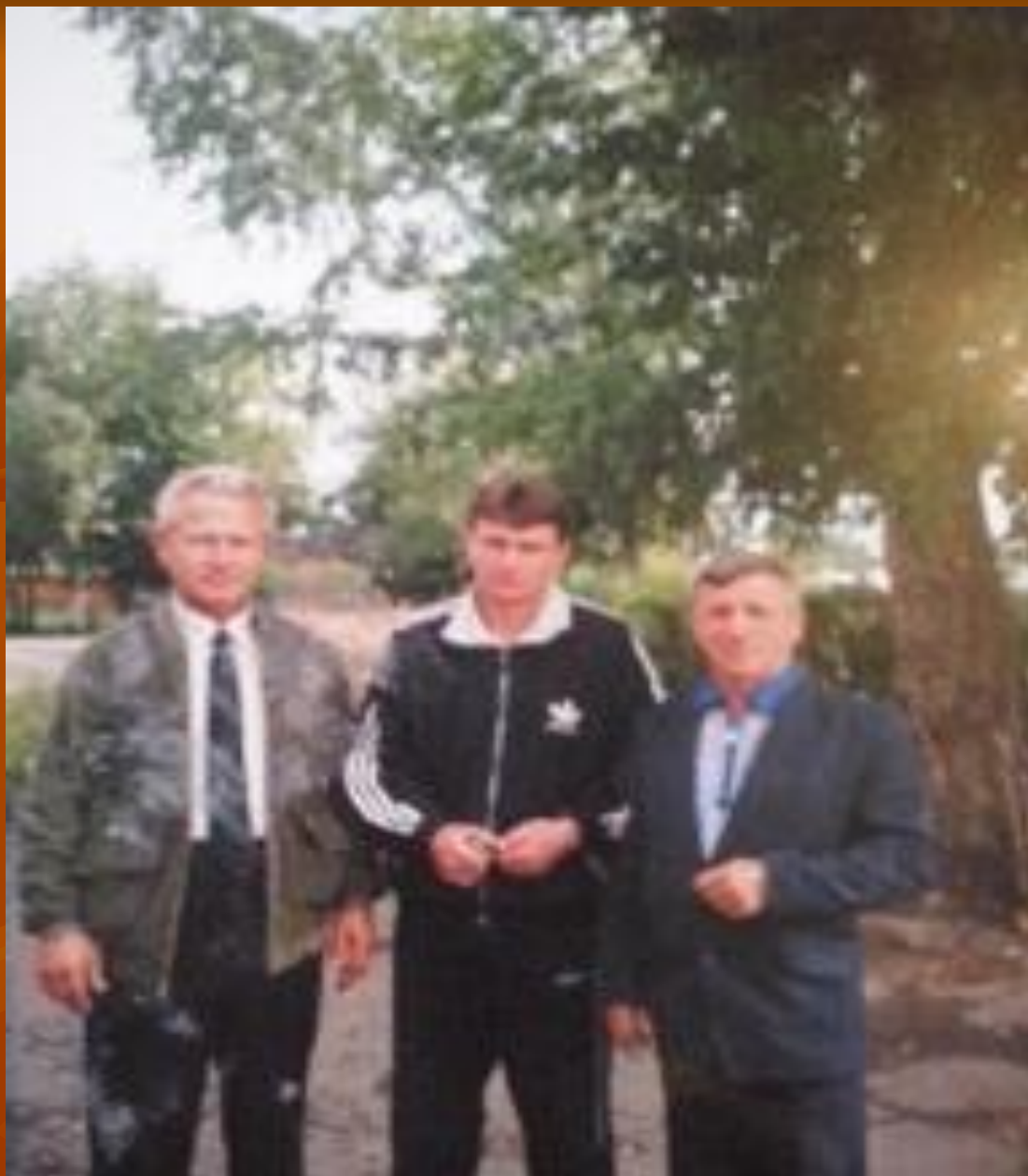
С учителями Шабановской школы