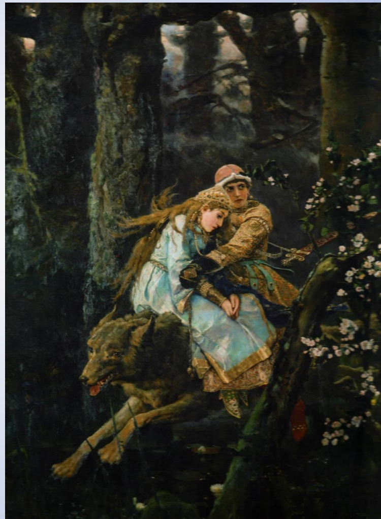
«Иван Царевич на сером волке»