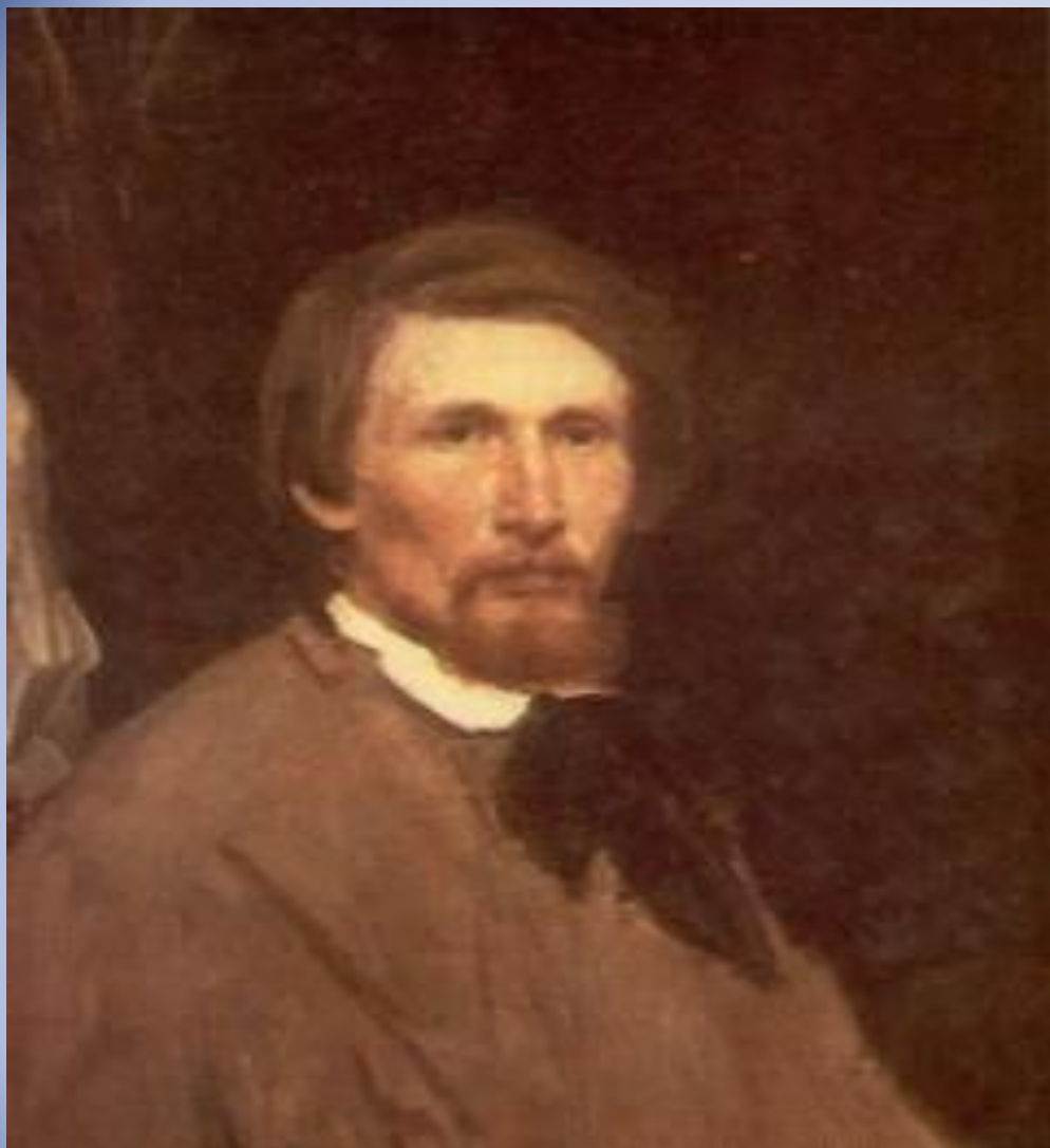
Виктор Михайлович Васнецов (1848-1926)