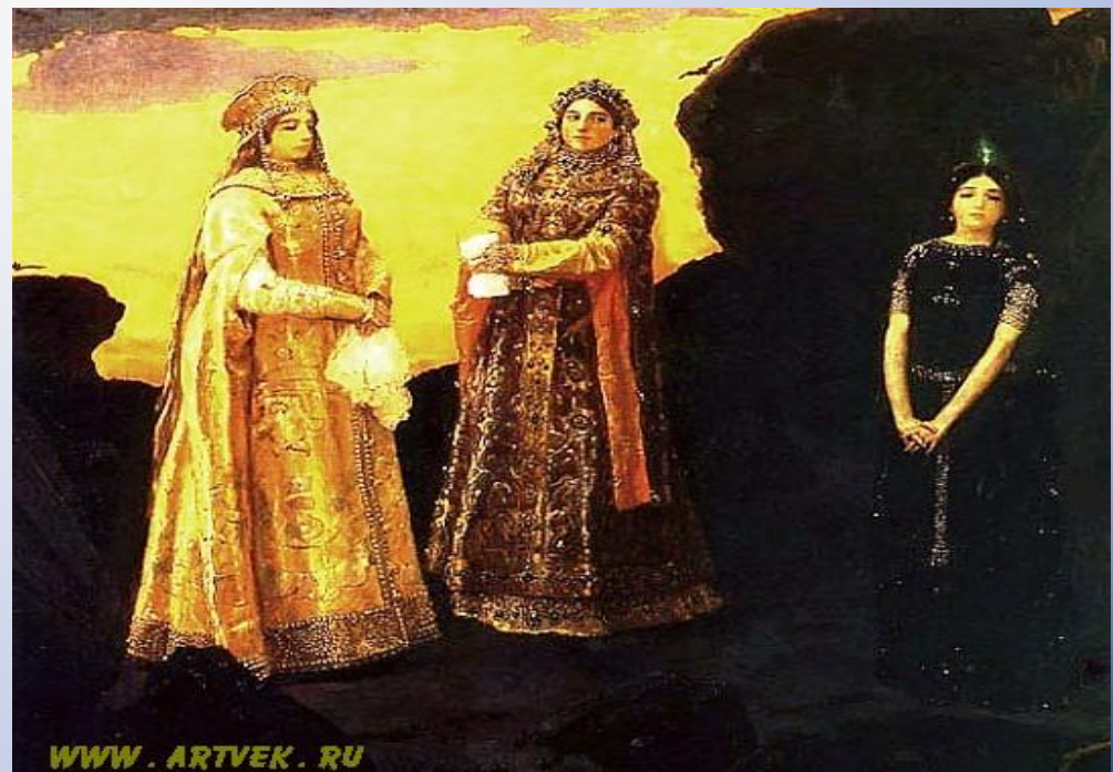
«Три царевны Тёмного царства»