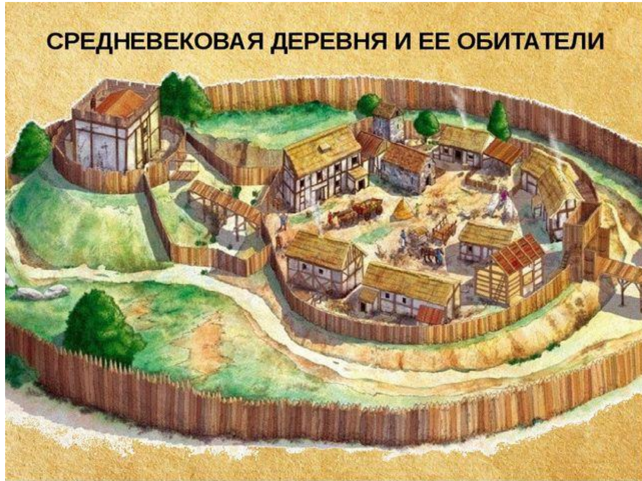
СРЕДНЕВЕКОВАЯ ДЕРЕВНЯ И ЕЕ ОБИТАТЕЛИ