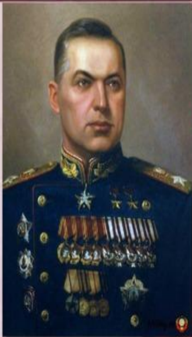
Командовал парадом Маршал Советского Союза Константин Константинович Рокоссовский