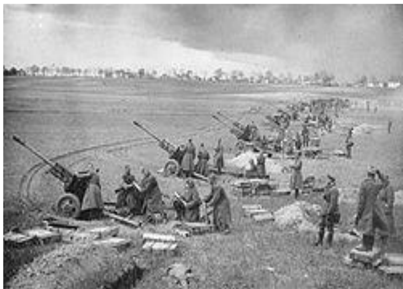
Советская артиллерия на подступах к Берлину, апрель 1945 г.