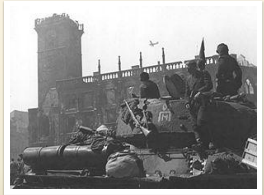
Бойцы Красной Армии вступили в Прагу