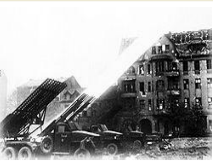
Залп советских реактивных установок Катюша по Берлину