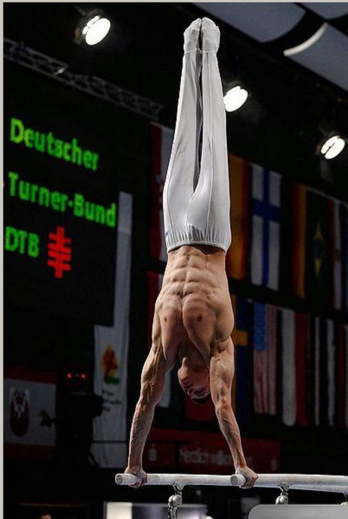
Гимнаст на параллельных брусьях

Гимнастика является технической основой многих видов спорта, соответствующие упражнения включаются в программу подготовки представителей самых разных спортивных дисциплин. Гимнастика не только дает определенные технические навыки, но и вырабатывает силу, гибкость, выносливость, чувство равновесия, координацию движений.