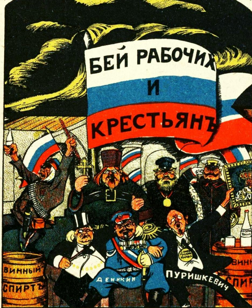
В. Дени («Банда Деникина», «Кулак-миродед»)