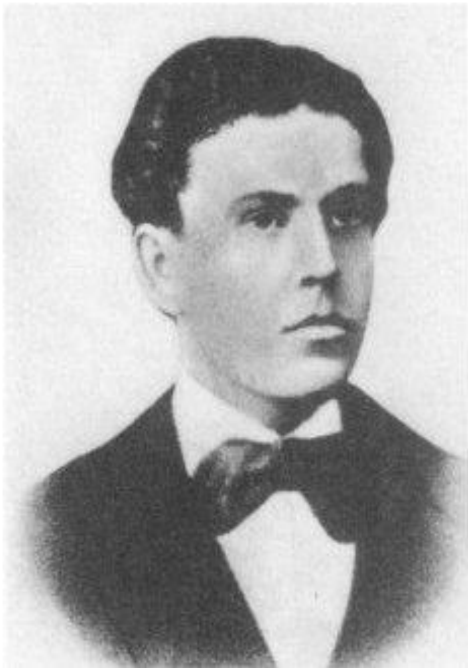
Гриневицкий Игнатий Иоахимович (1856- 1881 гг)