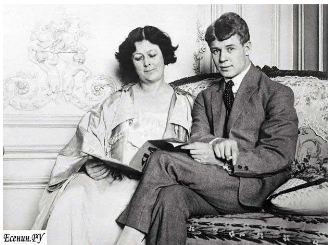
С. Есенин и А. Дункан. Берлин. 1922 г.

В 1921 Сергей Есенин женился на американской танцовщице Айседоре Дункан (1878-1927), взявшей фамилию Дункан-Есенина. Айседору Дункан, являвшуюся одной из основоположниц танца модерн, встречали переполненные театры по всей Европе. В 1920 Дункан была приглашена в Советскую Россию для организации собственной балетной школы. Вскоре за женитьбой с Есениным последовал развод, но 2 мая 1922 в загсе Хамовнического района Москвы состоялось повторное бракосочетание Сергея Есенина и американской танцовщицы Айседоры Дункан, взявшей фамилию Есенина. Осенью 1922 супруги уехали за границу. Посетив многие европейские страны, "исколесив всю Европу, кроме Испании", Есенин отправился в Америку, где пробыл четыре месяца до февраля 1923. В Москву вернулся 3 августа 1923.