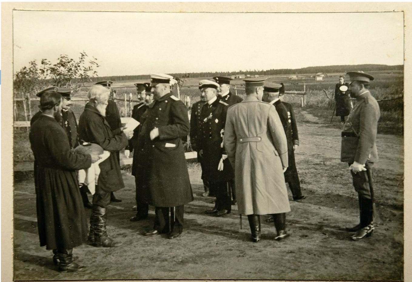
Поднесение адреса и хлѣба-соли П. А. Столыпину на хуторахъ близъ Москвы, въ Августѣ 1910 года.