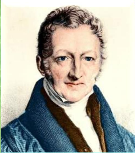
Томас Мальтус (1766—1834)

В 1798 году была опубликована книга Essay on the Principlea of Population («Очерк о законе народонаселения»)