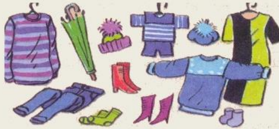
Товары и услуги