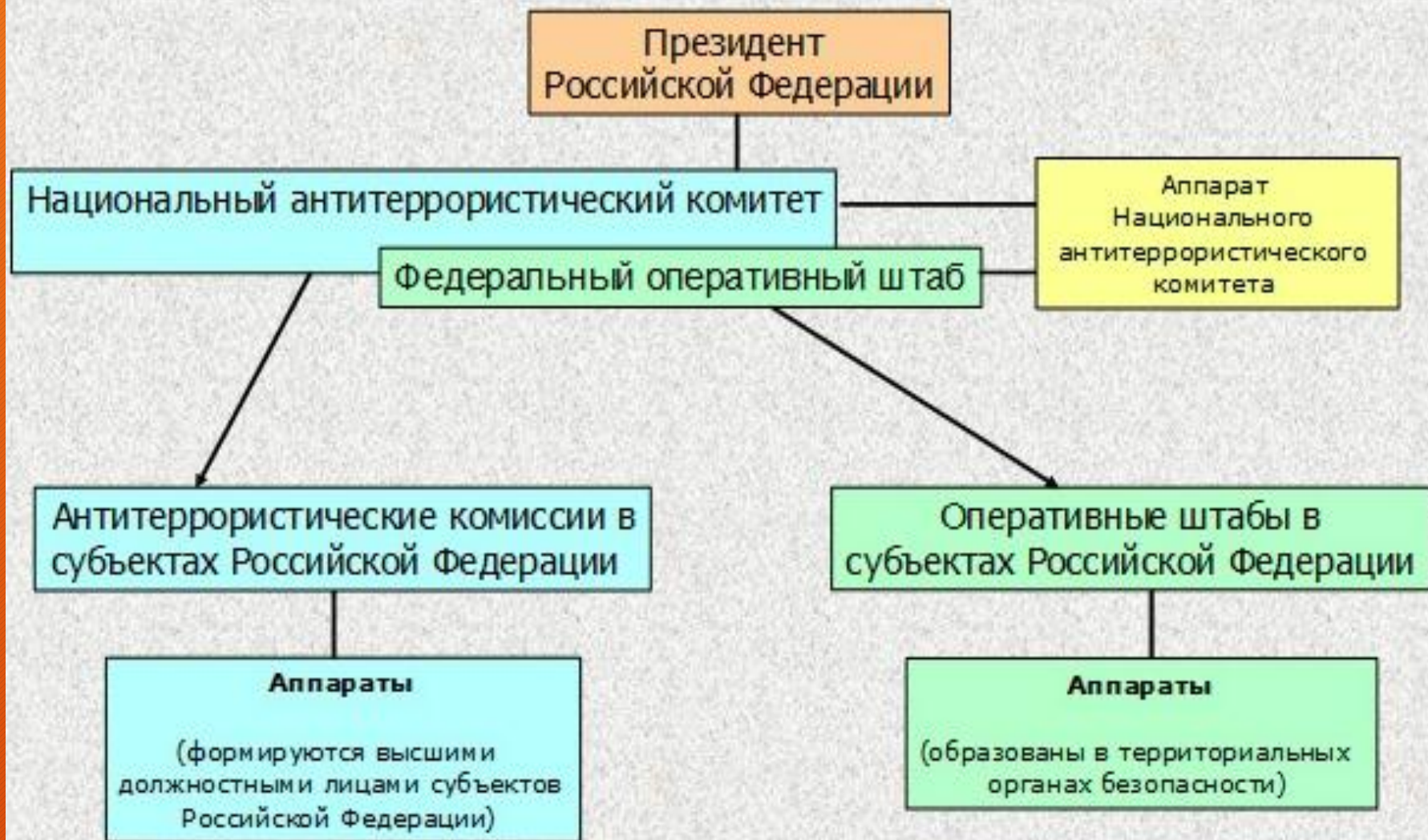
Схема координации деятельности по противодействию терроризму в Российской Федерации