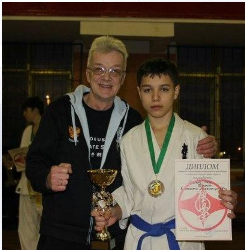
Учащийся МОУ «СОШ № 35 с УИОП» г. Воркуты