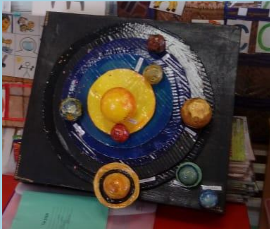
Макет «Солнечная система»